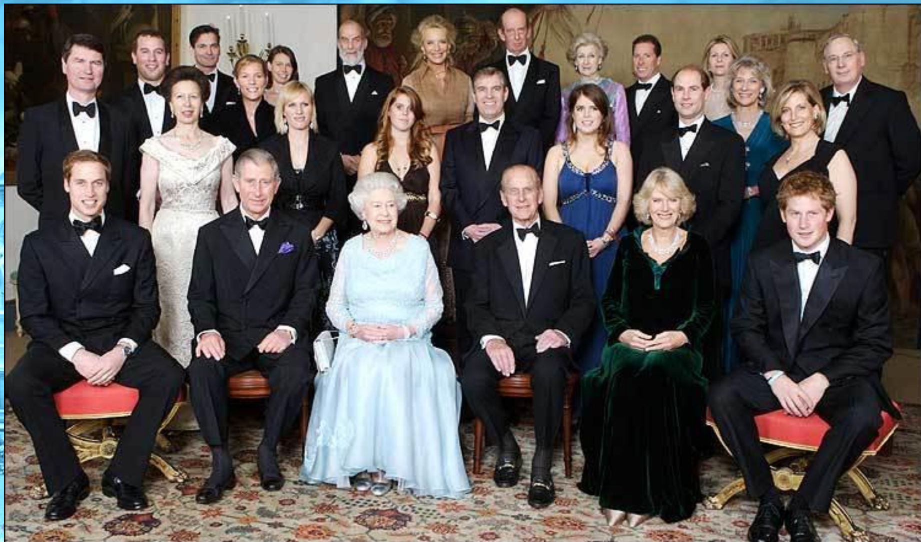
Члены королевской семьи (наши дни)