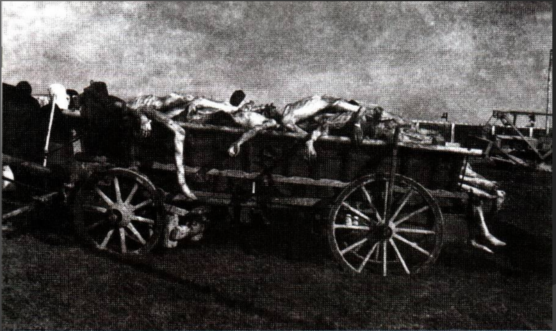
Тела жертв, уничтоженных в лагере Аушвиц-Биркенау.