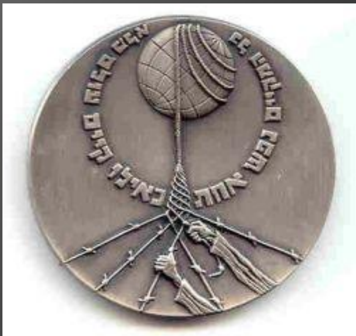
Медаль Праведника мира

Праведники мира - это, те, кто спасал евреев во время ХОЛОКОСТА, рискуя при этом собственной жизнью. До настоящего времени ЯД ВА-ШЕМ признал Праведниками мира около 15 тысяч человек.