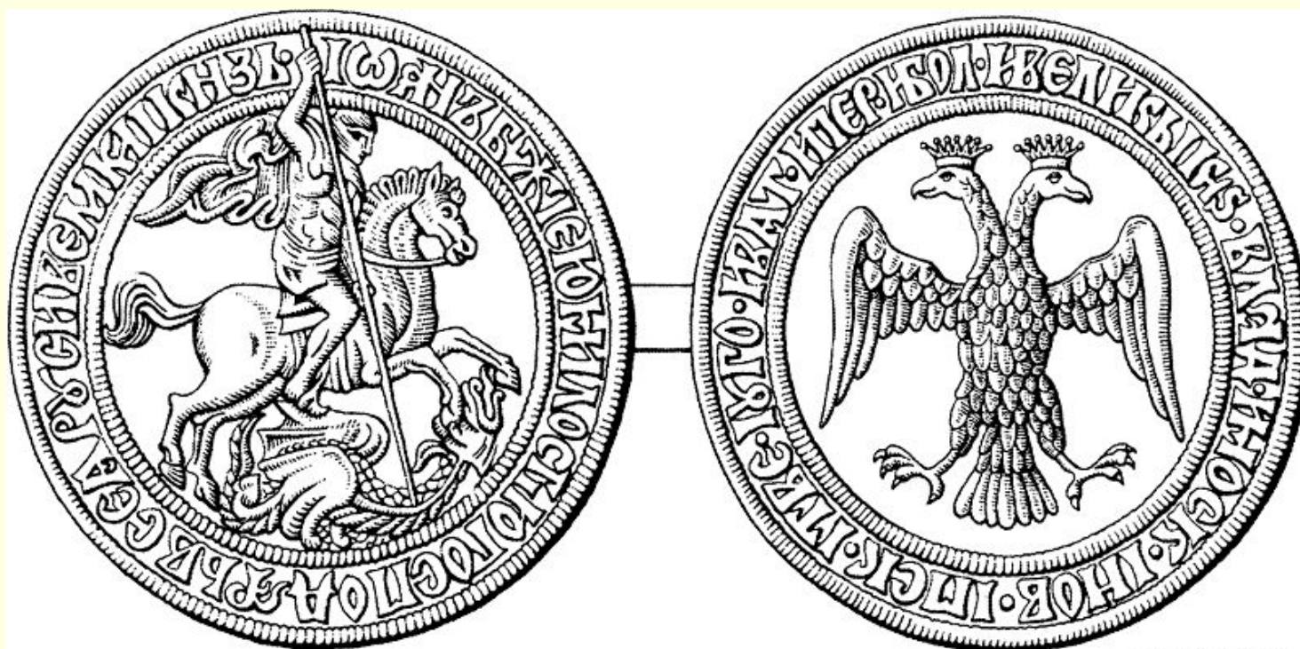
Печать Ивана III Васильевича. Конец XV в. Прорись А.Г. Силаева.

Двуглавый орел впервые появился на оборотной стороне первой известной печати на грамоте 1497 года.