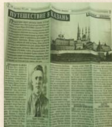
Батырлык матбугат битләрендә...