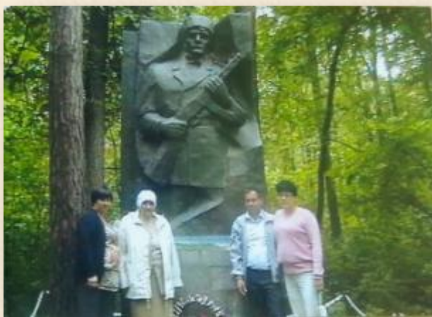
Флера апа гаиләсе белән әтисенең каберлеге янында