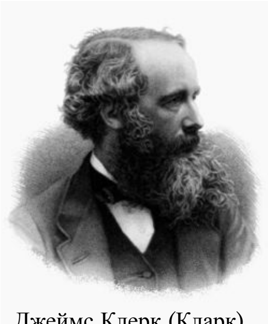
Джеймс Клерк (Кларк) Максвелл