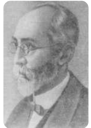
Гендрик Антон Лоренц