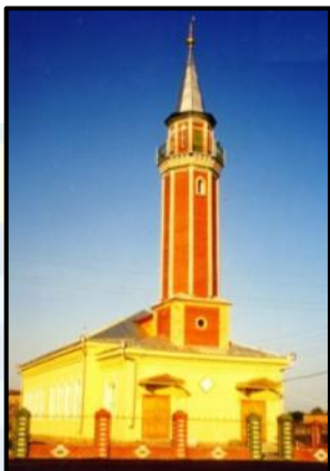
Теләнче Тамак авылы “Фәйзрахман” мәчете