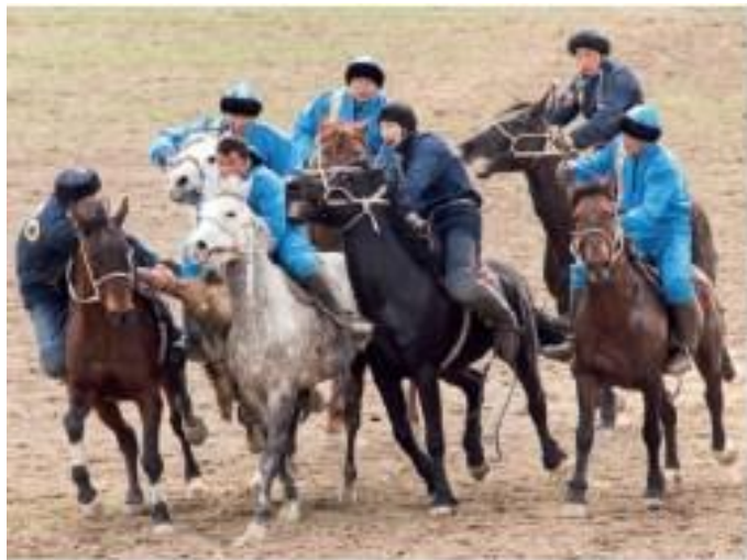
Рис. 2. Кокпар