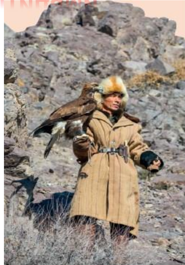
Рис. 3. Охотник с ловчей птицей