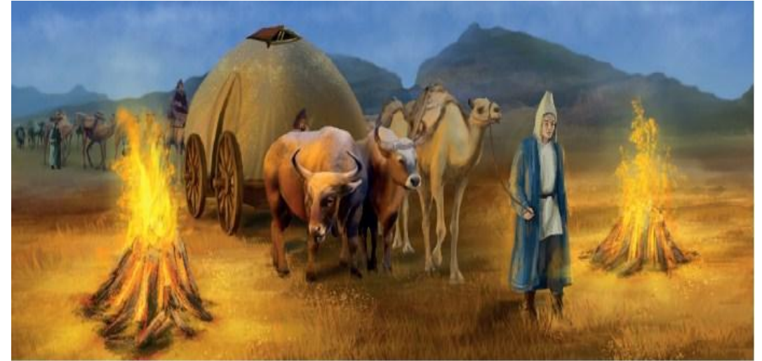
Рис. 2. Обряд аластау