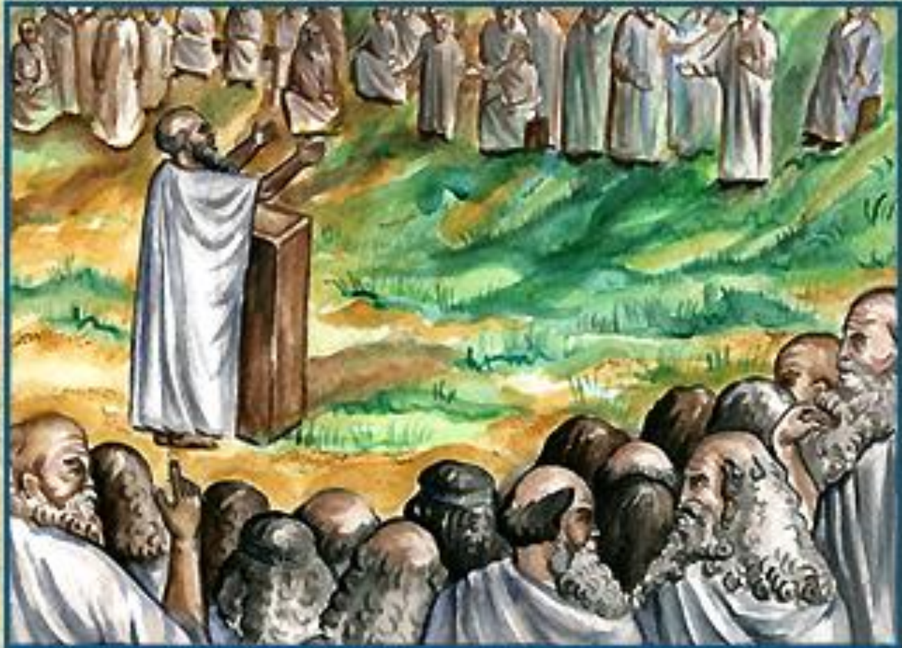
Афинское Народное собрание граждан