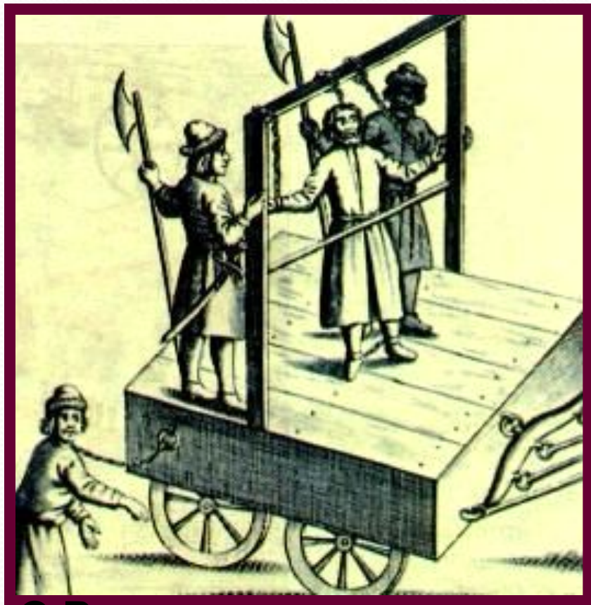
С.Разина везут на казнь. Гравюра к.17 в.