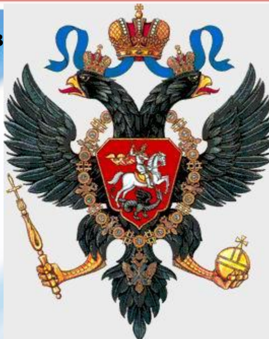
Герб начала 18 века

После утверждения на престол Петра I герб России претерпевает значительные изменения. Начинается эпоха великих преобразований. Столица переносится в Санкт - Петербург и Орел приобретает новые атрибуты. На головах появляются короны под одной общей большей, а на груди орденская цепь ордена Св. апостола Андрея Первозванного. Этот орден, утвержденный Петром в 1698 году, стал первым в системе высших государственных наград России. Святой апостол Андрей Первозванный, один из небесных патронов Петра Алексеевича, был объявлен покровителем. Кроме того, император повелел перекрасить золотого орла в черный цвет