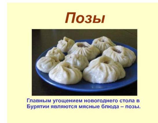
Главным угощением новогоднего стола в Бурятии являются мясные блюда – позы.