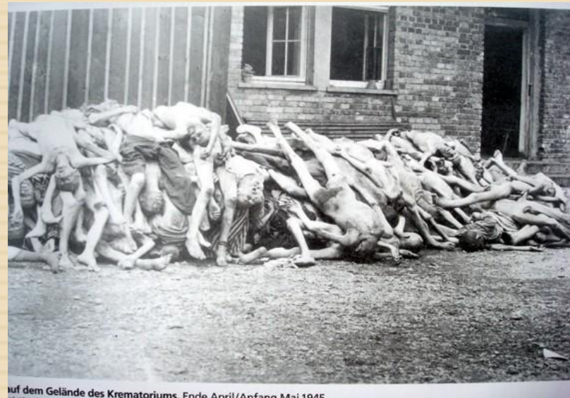
auf dem Gelände des Krematoriums. Ende April/Anfang Mai 1945