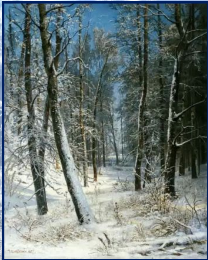
«Сосны, освещенные солнцем»