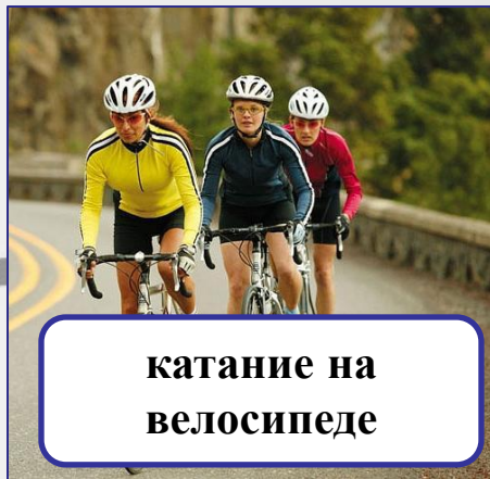
катание на велосипеде