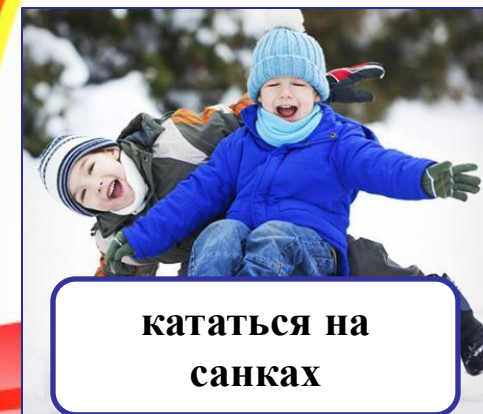
кататься на санках