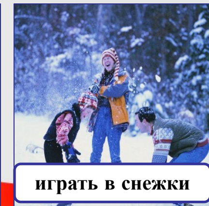
играть в снежки