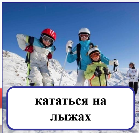
кататься на лыжах