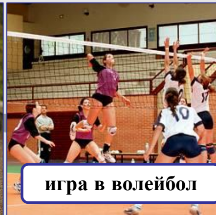
игра в волейбол