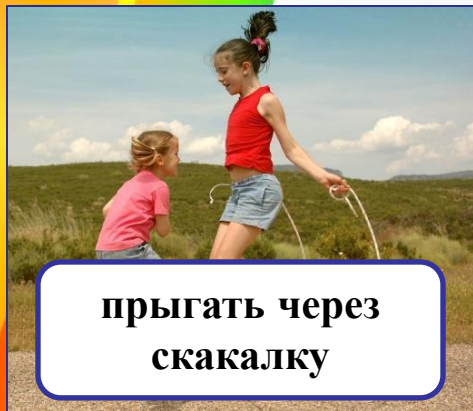
прыгать через скакалку