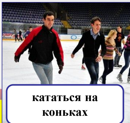
кататься на коньках