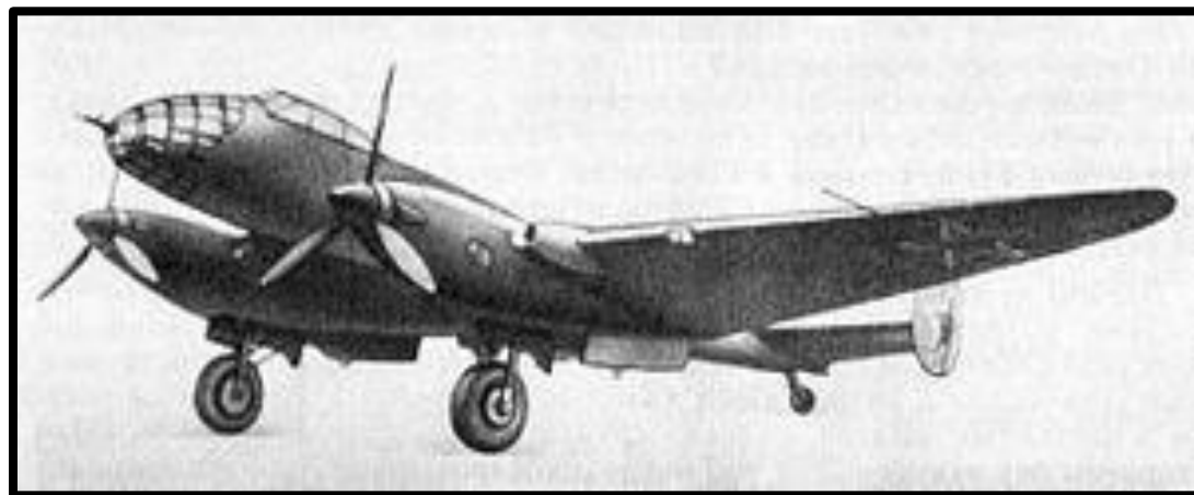
БР-2 (ДБ-240) — дальний бомбардировщик, двухмоторный моноплан с крылом типа «обратная чайка». Самолёт спроектирован в ОКБ-240 под руководством В. Г. Ермолаева