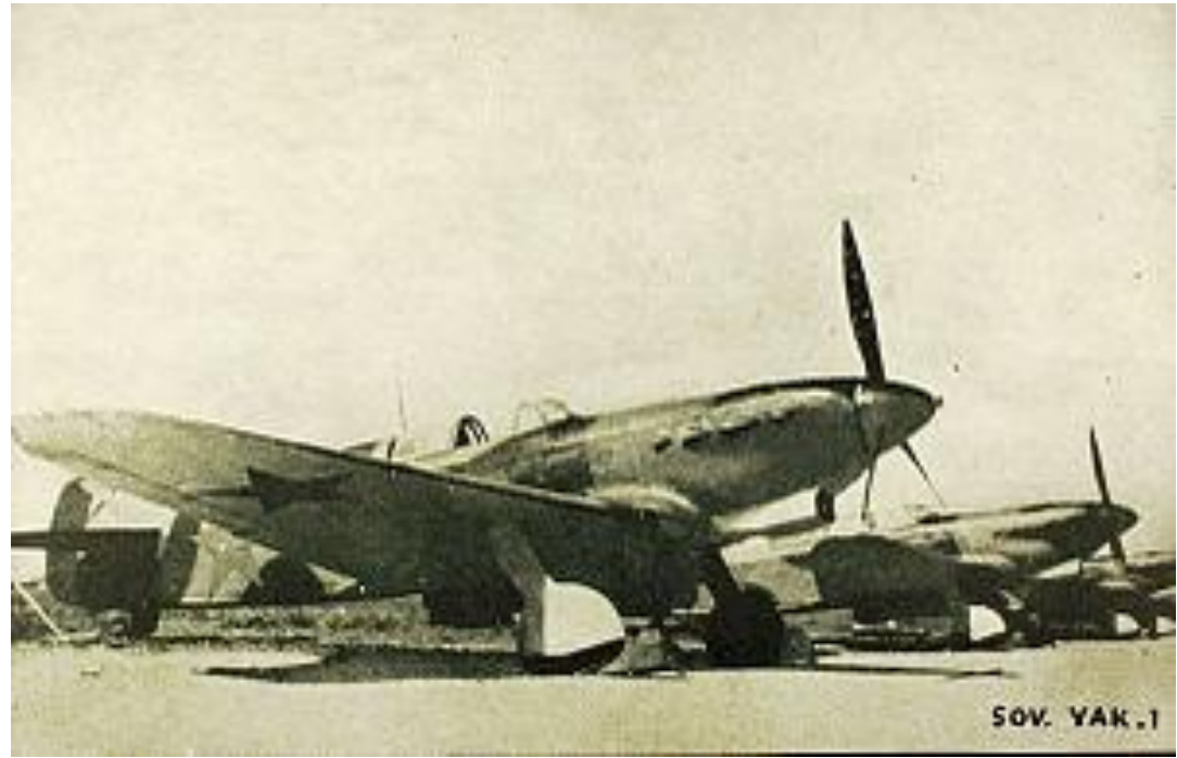
Як-1 — советский одномоторный самолёт-истребитель Великой Отечественной войны. Первый боевой самолёт, разработанный КБ под управлением Александра Сергеевича Яковлева как опытный истребитель И-26. После завершения государственных испытаний был принят в серийное производство под маркой Як-1. Производился с 1940 по 1944 годы; всего было построено 8734 самолёта всех модификаций.