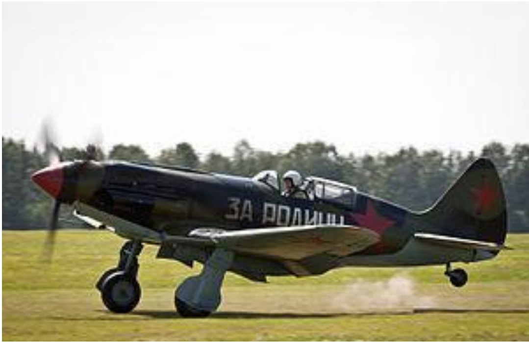
МиГ-3 — советский высотный истребитель времён Второй мировой войны.