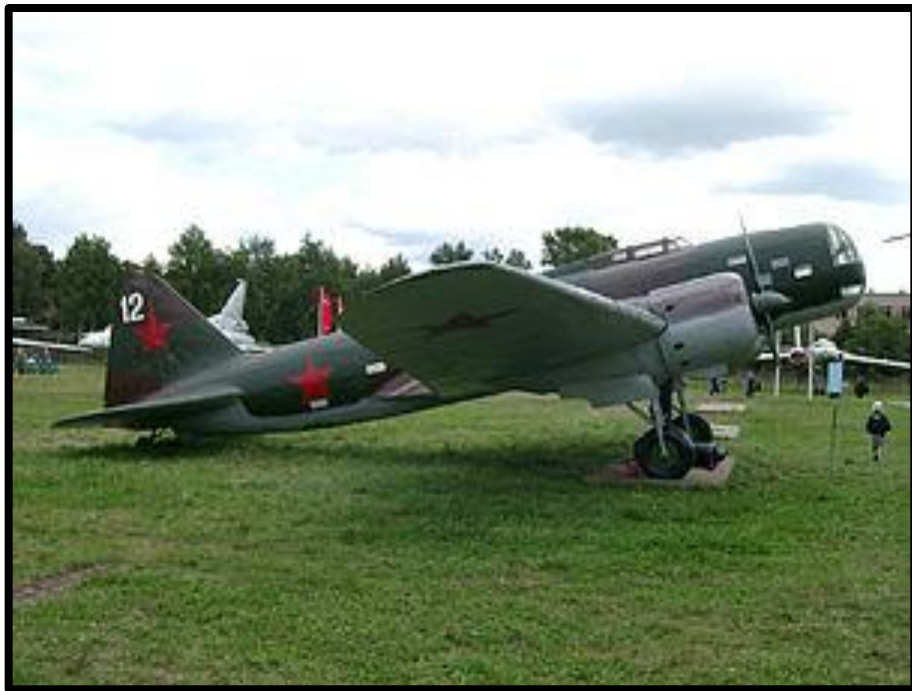
ДБ-3 (ЦКБ-30) — дальний бомбардировщик, разработанный в ОКБ-39 под руководством С. В. Ильюшина.