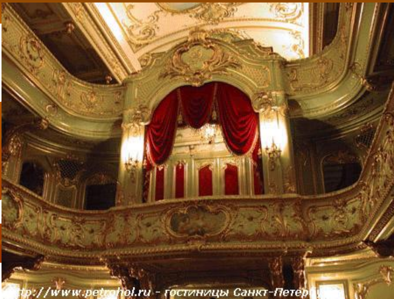
http://www.petrohol.ru - гостиницы Санкт-Петербург