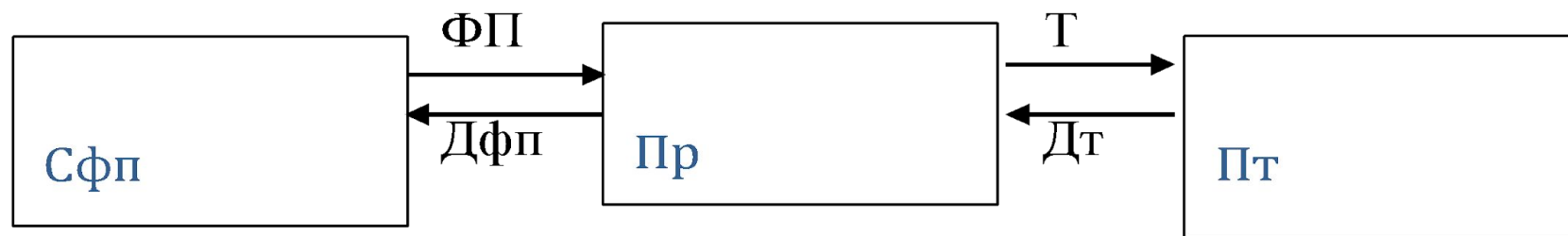
Схема предпринимательской сделки

Спф – собственники факторов предпринимательской деятельности;