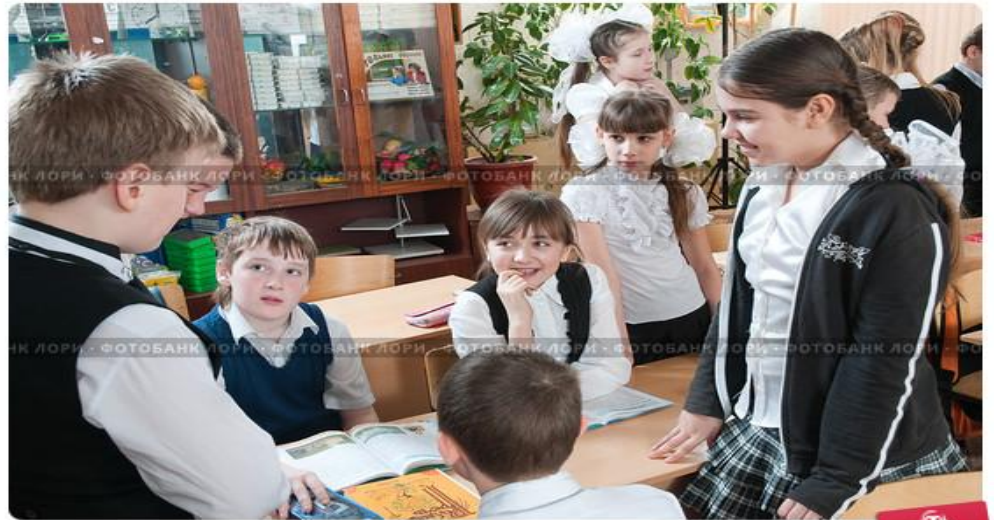
Общение детей на перемене в школе