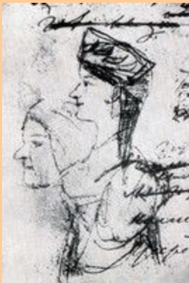
Черной Рисунк поэт