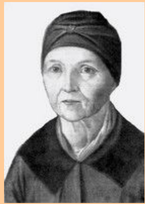
Няня А.С. Пушкина Арина Родионовна