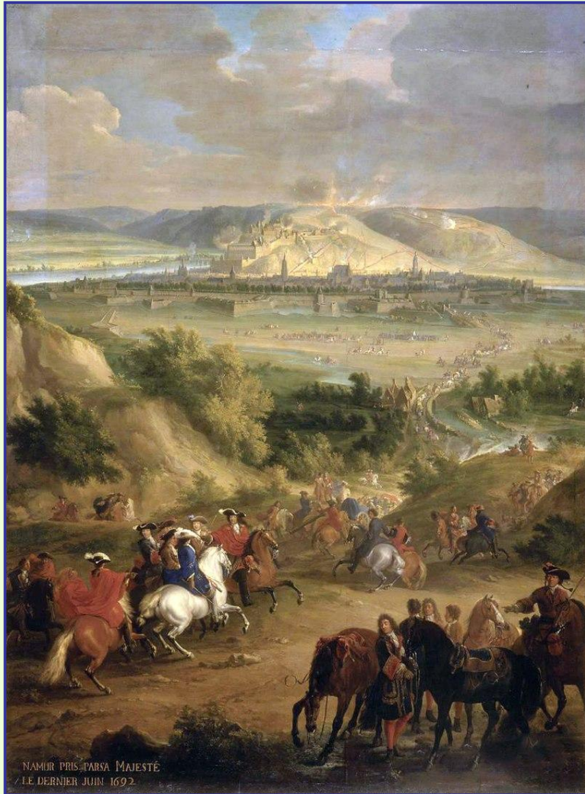
Осада города 1692 г.

Военные успехи Франции привели к созданию антифранцузской коалиции в которую вошли Священная Римская империя, Англия, Швеция, Испания, Савойя и республика Соединенных провинций.