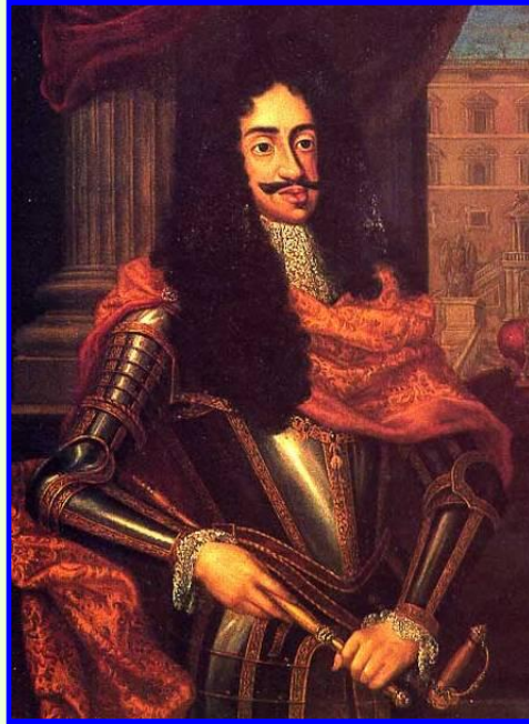
Император Леопольд I