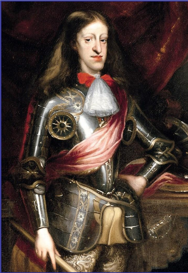
Карл II Габсбург