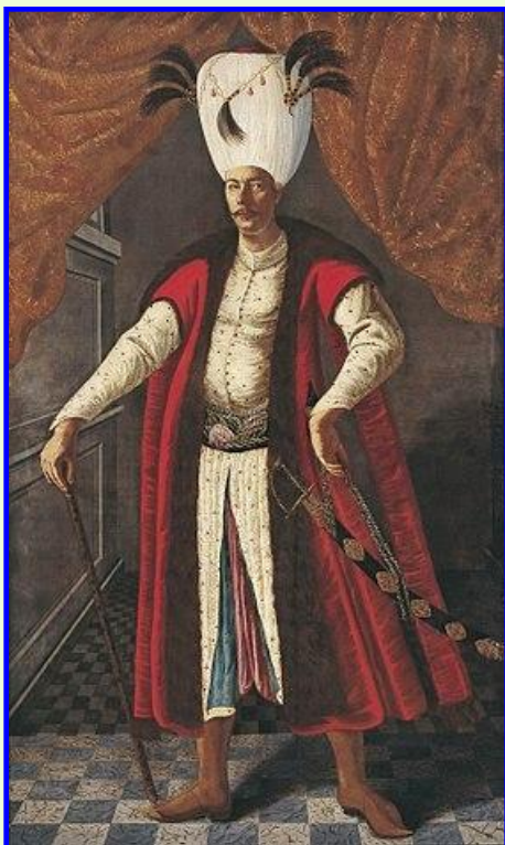
Султан Мехмед IV

Опасаясь наступления Турции и Крымского ханства, Россия стремилась укрепить свои позиции на Украине и в 1676 г. русские войска захватили г.Чигерин и вынудили гетмана Дорошенко сложить власть. В ответ на это Османская империя и ее вассалы начали войну и в 1678 г. отвоевала Чигерин.