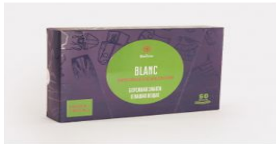
#03101 ПЛАСТИНЫ ДЛЯ СТИРКИ УНИВЕРСАЛЬНЫЕ BIOTRIM BLANC