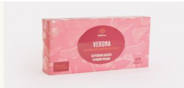
#03102 ПЛАСТИНЫ ДЛЯ СТИРКИ ЖЕНСКОГО БЕЛЬЯ BIOTRIM VERONA