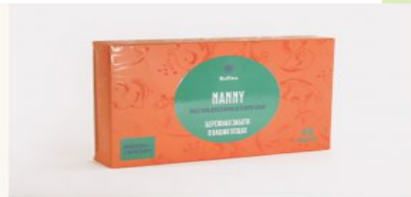
#03103 ПЛАСТИНЫ ДЛЯ СТИРКИ ДЕТСКОГО БЕЛЬЯ BIOTRIM NANNY