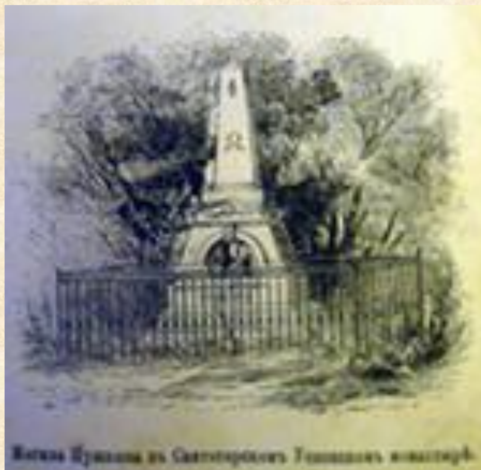
Могилка Пушкина в Смоленском кладбище в Москве.