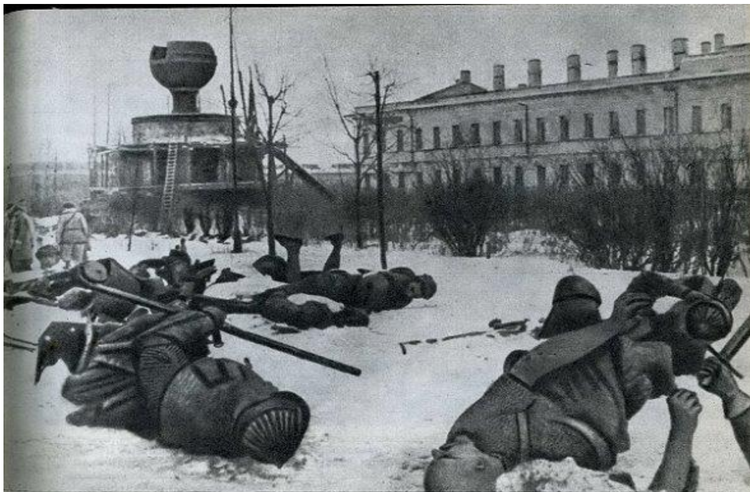
Памятник «Тысячелетие России» в Новгороде, разрушенный оккупантами. Зима 1944 г.