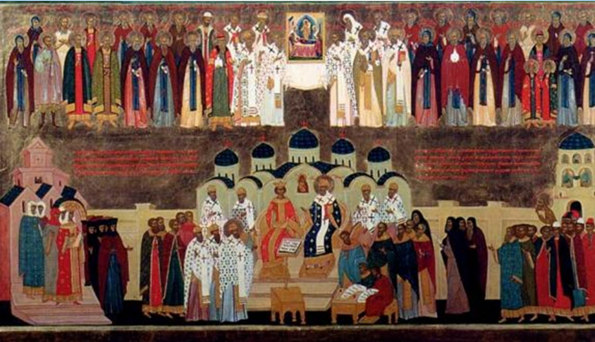
Церковные соборы 1547,1549гг. Современная икона