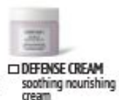
DEFENSE CREAM soothing nourishing cream