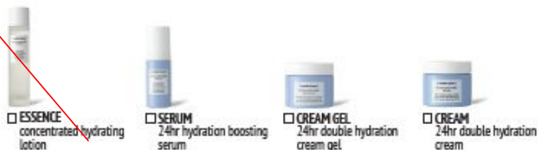
ESSENCE concentrated hydrating lotion

Improving cellular water diffusion and the barrier protective function. With Hyaluronic Acid, Biomimetic Fragments and Fair-trade Moringa Oil, it is recommended when skin feels dehydrated, looks dull and for frequent flyers.