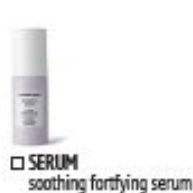
SERUM soothing fortifying serum

For delicate, hyper-sensitive skin, fragrance-free formulas rich in a Prebiotic from Sugar, Marvel of Peru and Marula Oil for immediate relief and repair and optimal cutaneous defense.