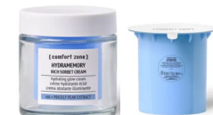
КРЕМ крем для увлажнения и сияния