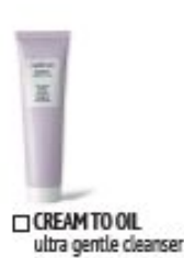
CREAM TO OIL ultra gentle cleanser