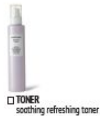
TONER soothing refreshing toner