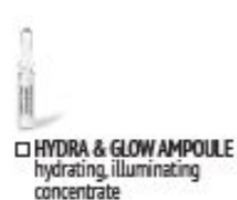
HYDRA & GLOW AMPOULE hydrating, illuminating concentrate