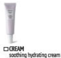
CREAM soothing hydrating cream