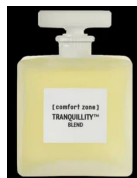
СМЕСЬ АРОМА-МАСЕЛ смесь ароматических масел