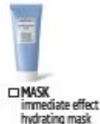
MASK immediate effect hydrating mask