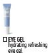
EYE GEL hydrating refreshing eye gel