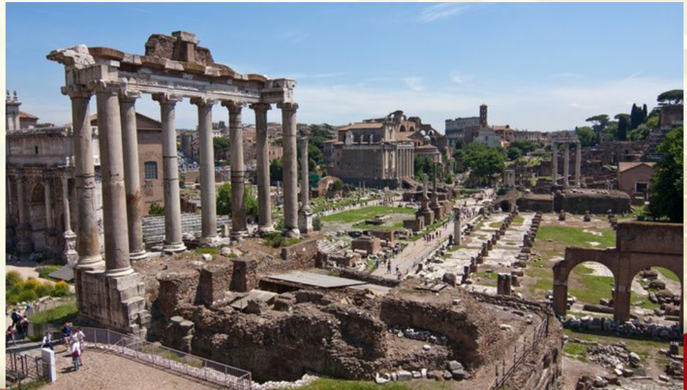
Forum Romanum - současnost

Průvozná ekonomická fakulta Justinianův zákoník