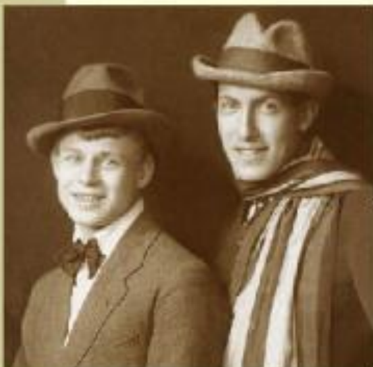
Мариенгоф и Есенин, 1919 год