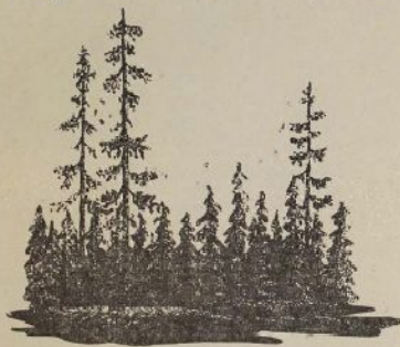
Роман һәм повестар