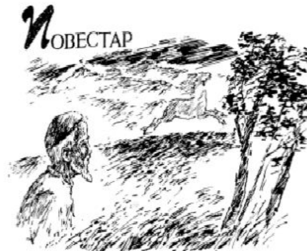
ТӨПКӨЛДӘН ТӨШКӘН КИЛЕН

Ноғман Мусиндың “Төпкөлдән төшкән килен” повесында тәбиғәتكә карата битарафлыктың сағылышы каралды.