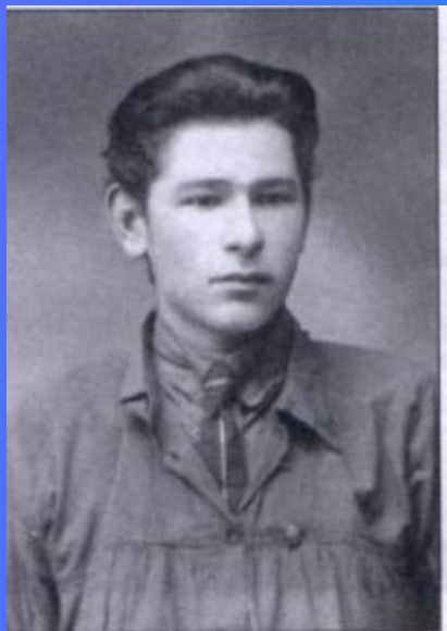
Әмирхан Еники. 1926 ел.