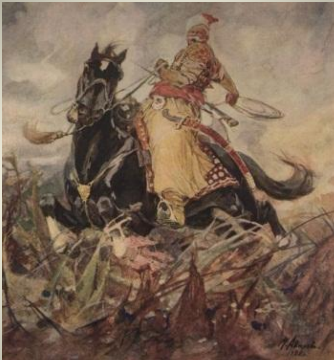
Сочинение по повести Н. В. Гоголя «Тарас Бульба»