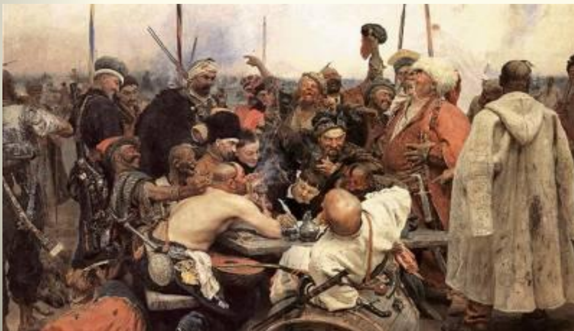
И.Е.Репин «Запорожцы пишут письмо турецкому султану»