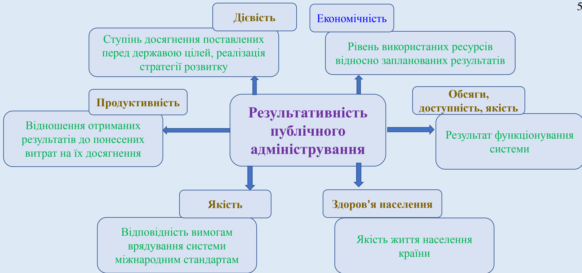
Рис. 2. Результативність публічного адміністрування