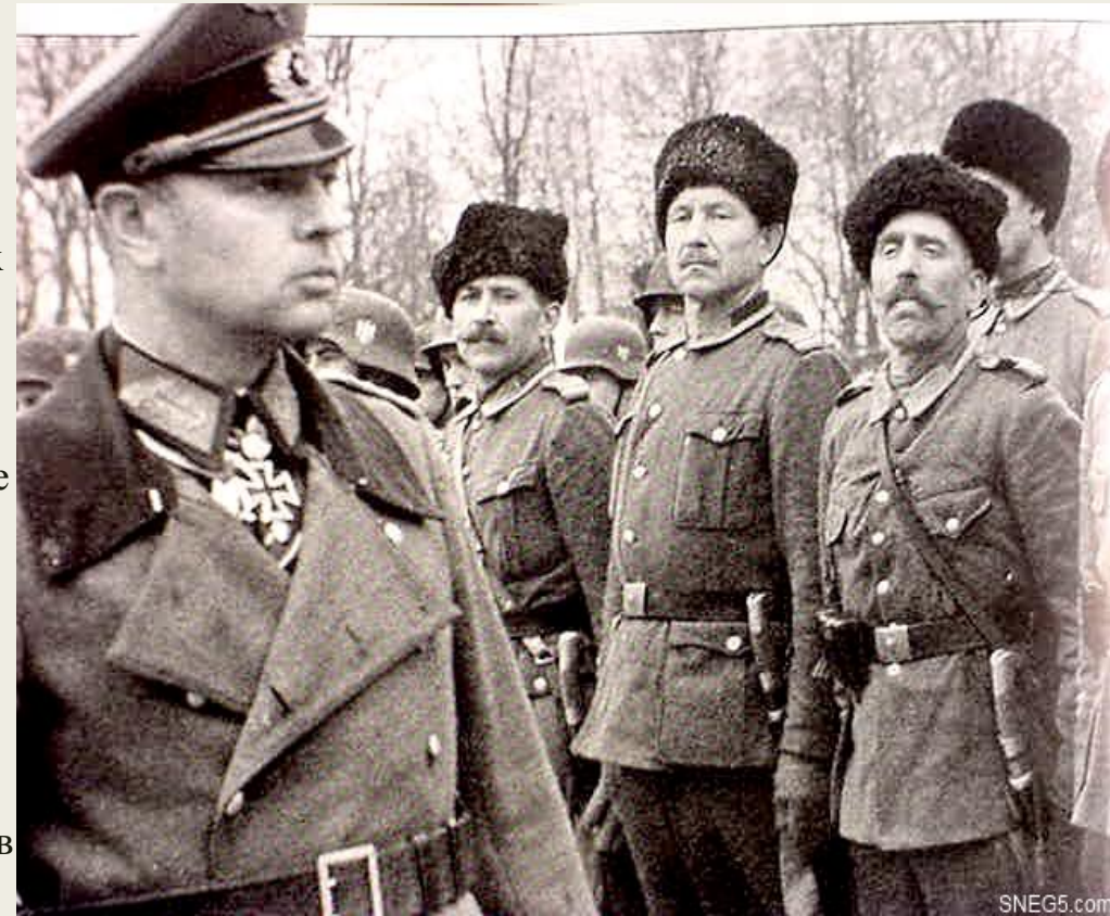
Группенфюрер СС генерал-лейтенант Г. фон Паннвиц на смотре частей XV казачьего кавалерийского корпуса СС в Лиенце

10 октября 1943 г. вышел приказ Гитлера о переброске некоторых коллаборационистских частей во Францию, Италию и на Балканы. Приказ о передислокации в Европу был очень непопулярен среди казаков. Стараясь смягчить недовольство, казакам разрешили ношение казачьей униформы, молодых казаков отправили в кавалерийскую школу в Германии. Общее руководство казачьими частями в вермахте осуществлял отдел добровольческих формирований при главном командовании сухопутных войск Германии. К этому времени всё чаще стали фиксироваться переходы военнослужащих коллаборационистских формирований на сторону РККА. Поэтому менялись планы их использования. 1-ю казачью дивизию немецкое командование первоначально предполагало отправить на Восточный фронт, но обстановка заставила перебросить её в сентябре 1943 г. в Югославию. В междуречье Дуная и Тисы эта дивизия вела боевые действия против партизан. В августе 1944 г. все иностранные национальные формирования перешли в ведение СС. Г. Гиммлер, отвечавший за создание негерманских соединений, принял решение о развёртывании 1-й казачьей дивизии в корпус. Когда в декабре 1944 г. войска 3-го Украинского фронта РККА вошли в долину реки Драва, германское командование выдвинуло им навстречу 1-ю казачью дивизию. Чтобы избежать окружения, советские войска отошли, потеряв 205 человек убитыми. 145 красноармейцев попали в плен.