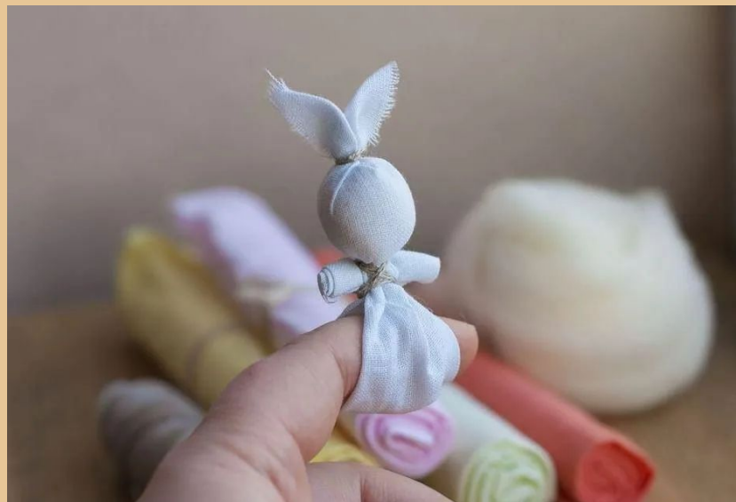
Зайчик на пальчик