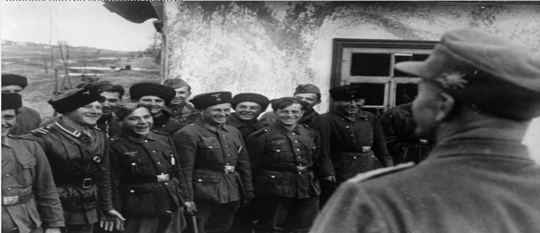
Казачьи части в составе вермахта (1944)