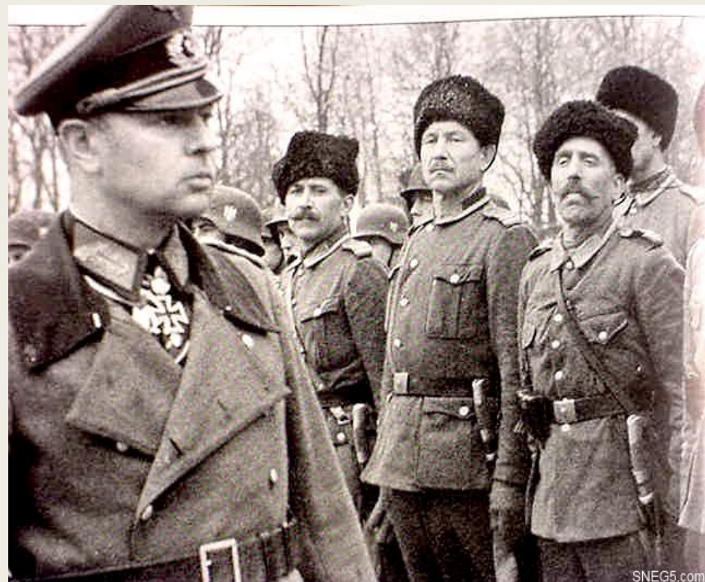
Группенфюрер СС генерал-лейтенант Г. фон Паннвиц на смотре частей XV казачьего кавалерийского корпуса СС в Лиенце

10 октября 1943 г. вышел приказ Гитлера о переброске некоторых коллаборационистских частей во Францию, Италию и на Балканы. Приказ о передислокации в Европу был очень непопулярен среди казаков. Стараясь смягчить недовольство, казакам разрешили ношение казачьей униформы, молодых казаков отправили в кавалерийскую школу в Германии. Общее руководство казачьими частями в вермахте осуществлял отдел добровольческих формирований при главном командовании сухопутных войск Германии. К этому времени всё чаще стали фиксироваться переходы военнслужащих коллаборационистских формирований на сторону РККА. Поэтому менялись планы их использования. 1-ю казачью дивизию немецкое командование первоначально предполагало отправить на Восточный фронт, но обстановка заставила перебросить её в сентябре 1943 г. в Югославию. В междуречье Дуная и Тисы эта дивизия вела боевые действия против партизан. В августе 1944 г. все иностранные национальные формирования перешли в ведение СС. Г. Гиммлер, отвечавший за создание негерманских соединений, принял решение о развёртывании 1-й казачьей дивизии в корпус. Когда в декабре 1944 г. войска 3-го Украинского фронта РККА вошли в долину реки Драва, германское командование выдвинуло им навстречу 1-ю казачью дивизию. Чтобы избежать окружения, советские войска отошли, потеряв 205 человек убитыми. 145 красноармейцев попали в плен.