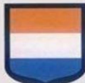
Шарлемань "Карл Великий"