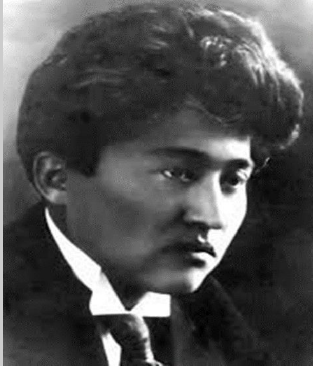
Мағжан Жұмабаев (1893 – 1938)