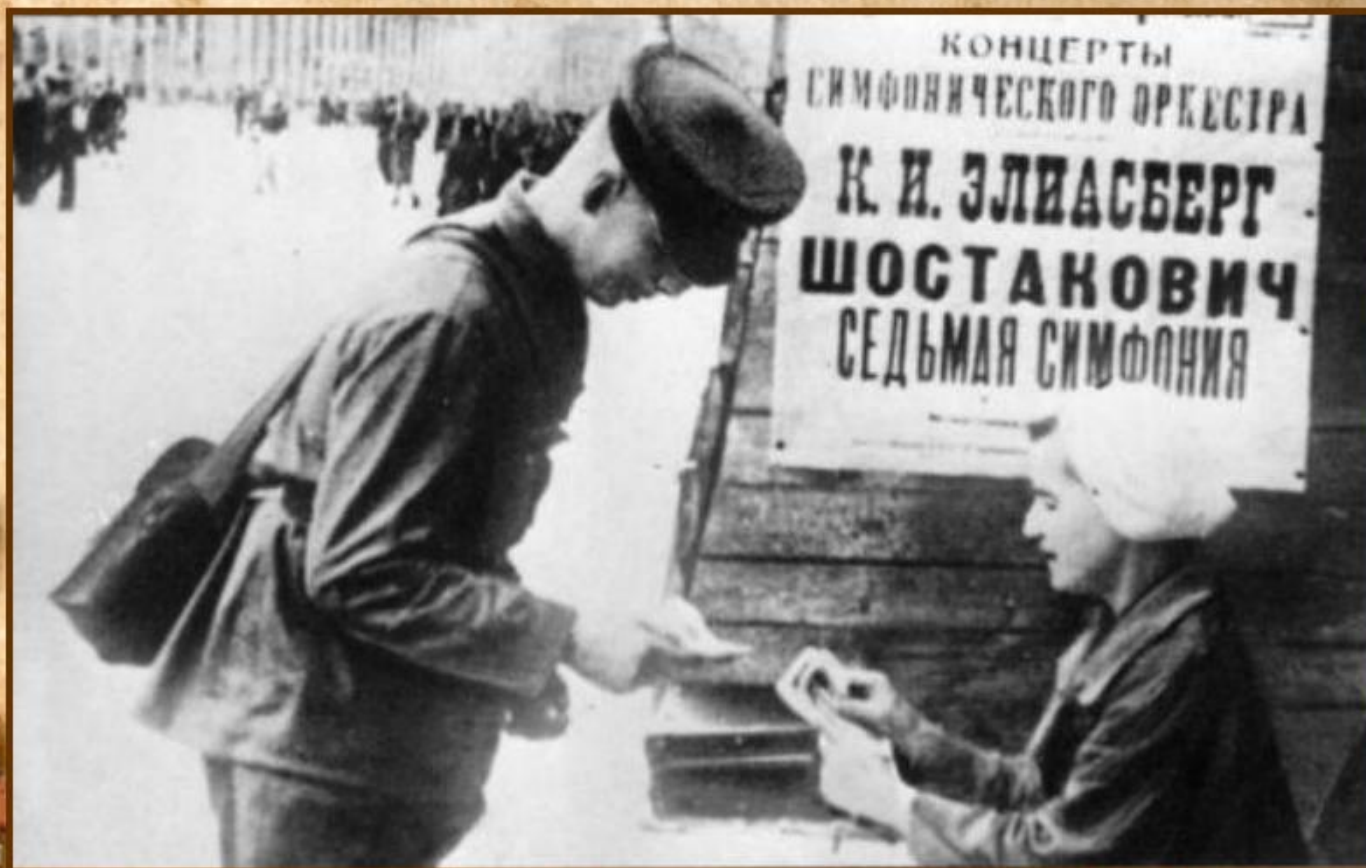
Афиша в блокадном Ленинграде

После куйбышевской, премьеры симфонии прошли в Москве и Новосибирске . Но самая замечательная, поистине героическая премьера состоялась в осажденном Ленинграде