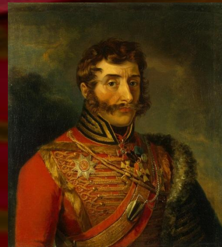
Николай Николаевич Раевский