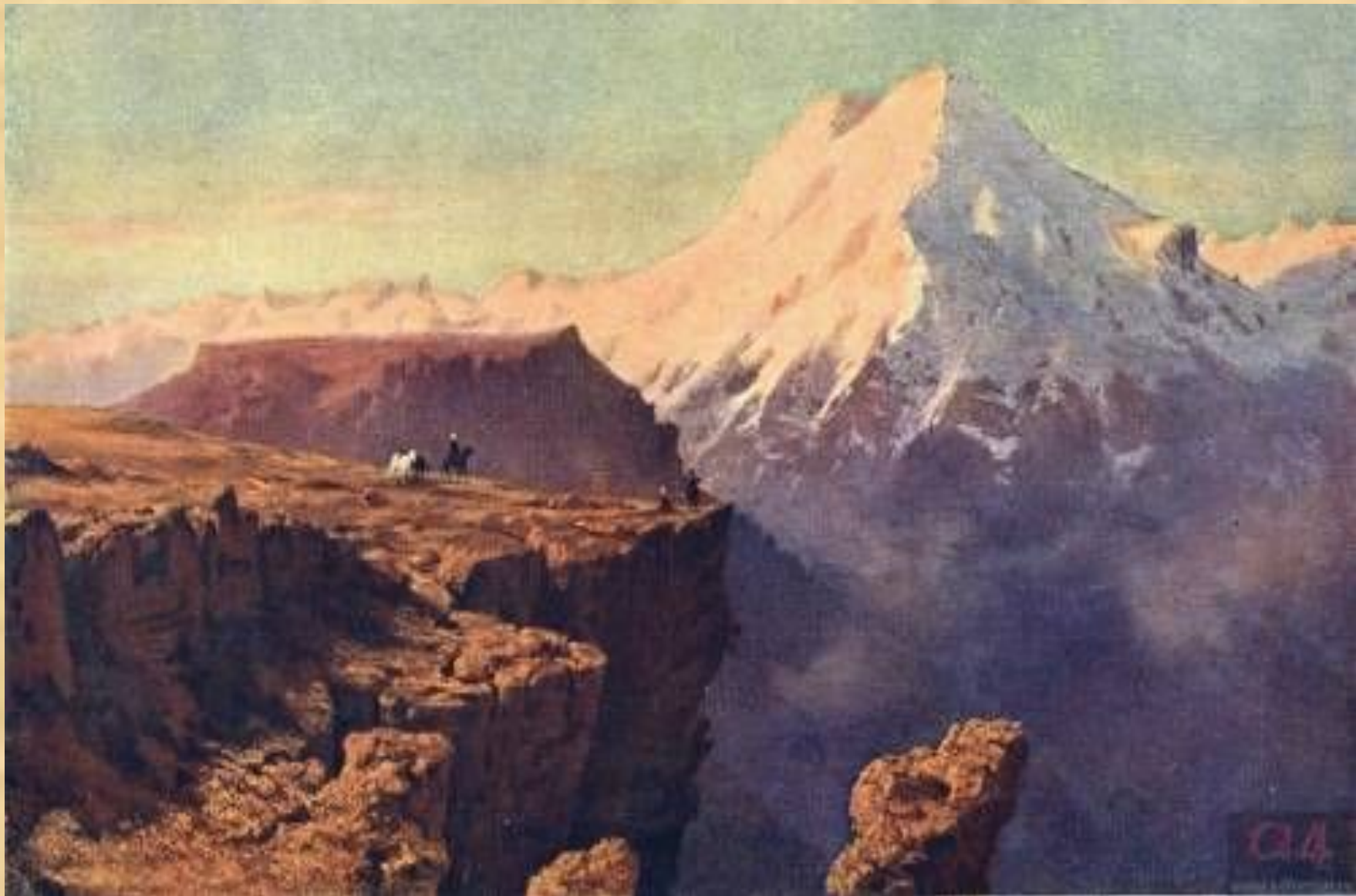
Кавказский вид с Эльбрусом. Масло. 1837