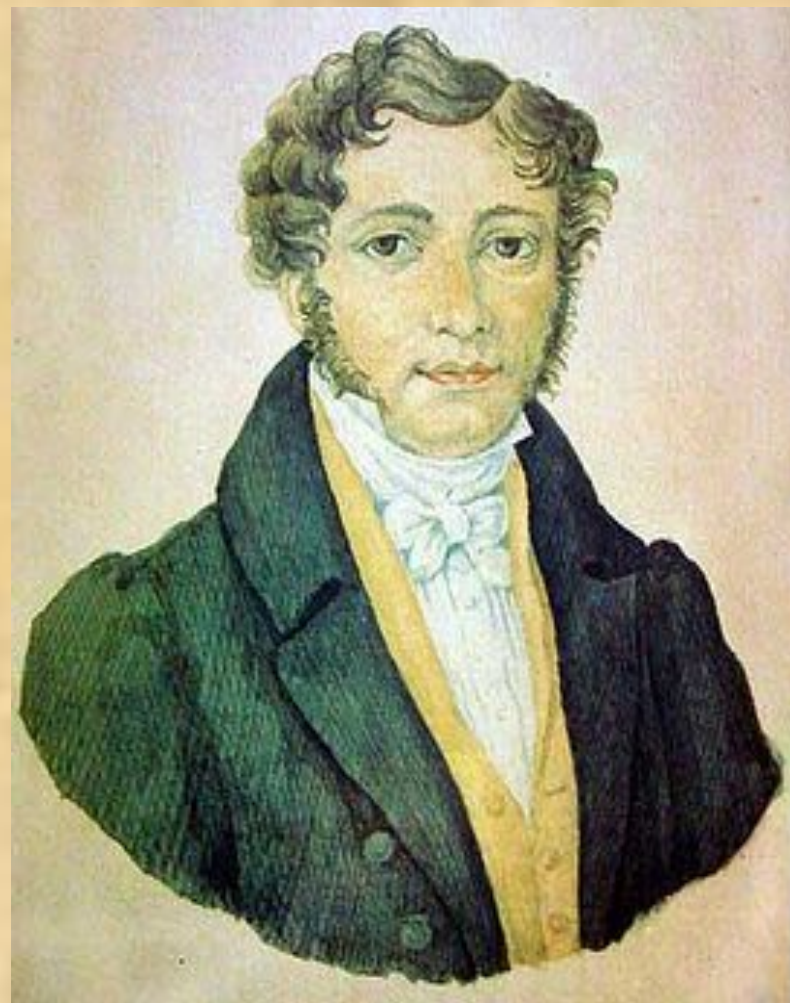
Отец Лермонтова Акварель. 1828 г.