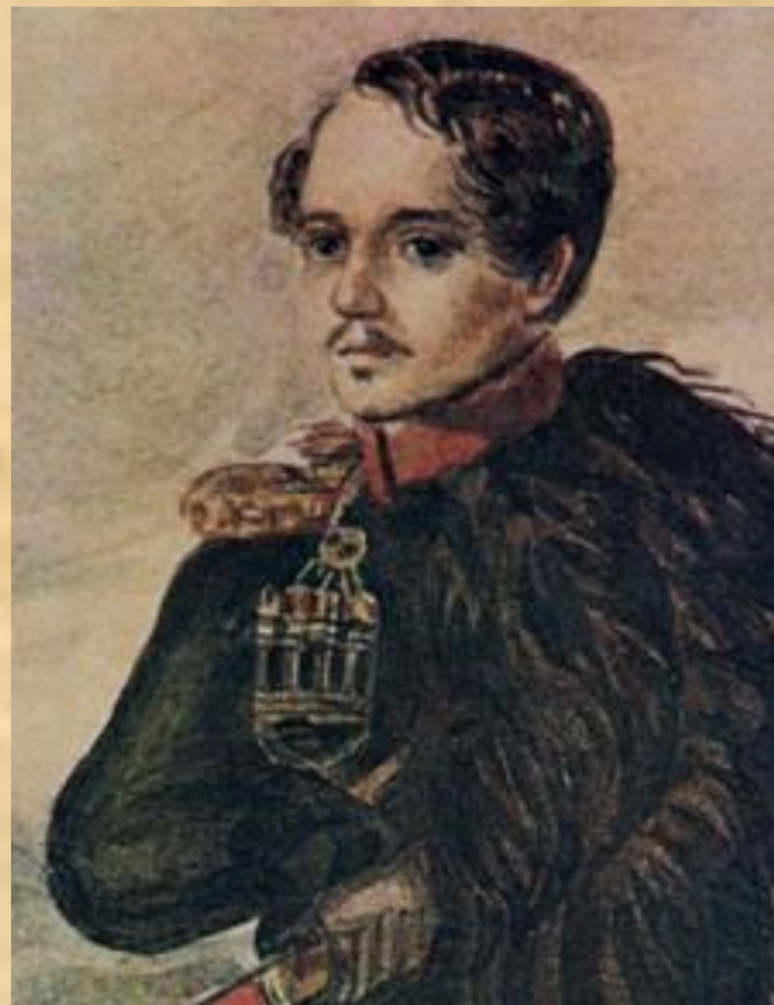
Автопортрет в бурке. Масло. 1837г.