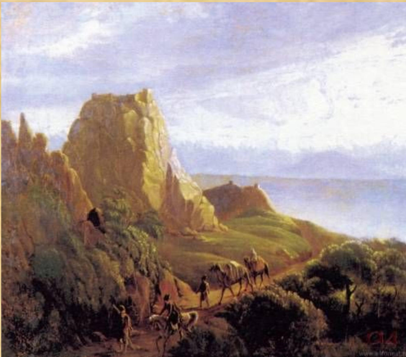
Кавказский вид с верблюдами Развалины скалы Тамарасцихе близ селения Карагач. Масло. 1837—38 г.