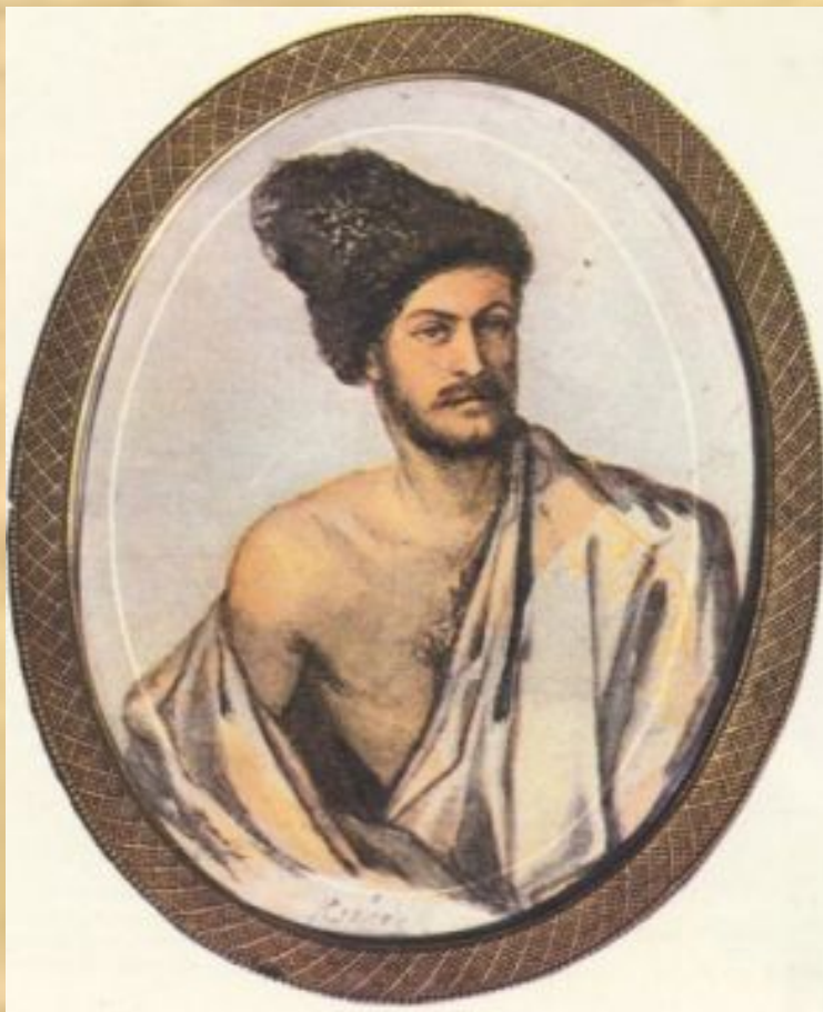
А. А. Столыпин (Монго) в костюме курда. Акварель. 1841 г.