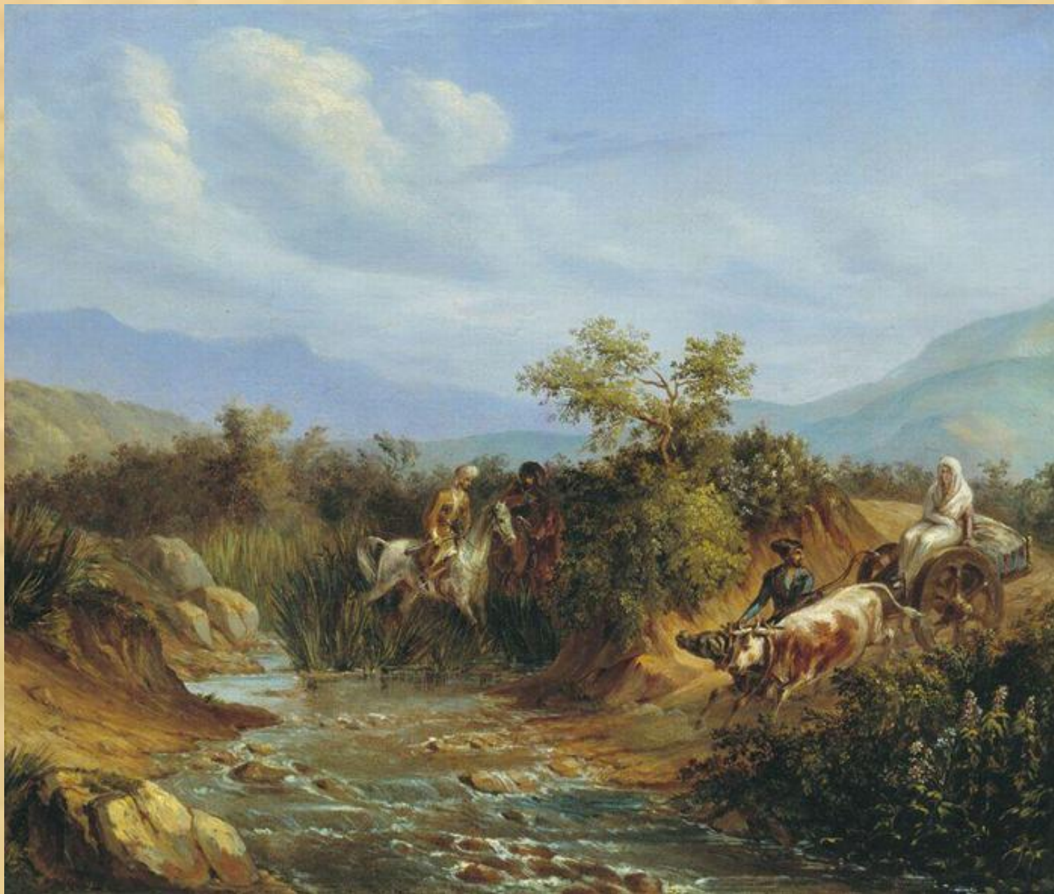
Сцена из кавказской жизни. Масло. 1838 г.