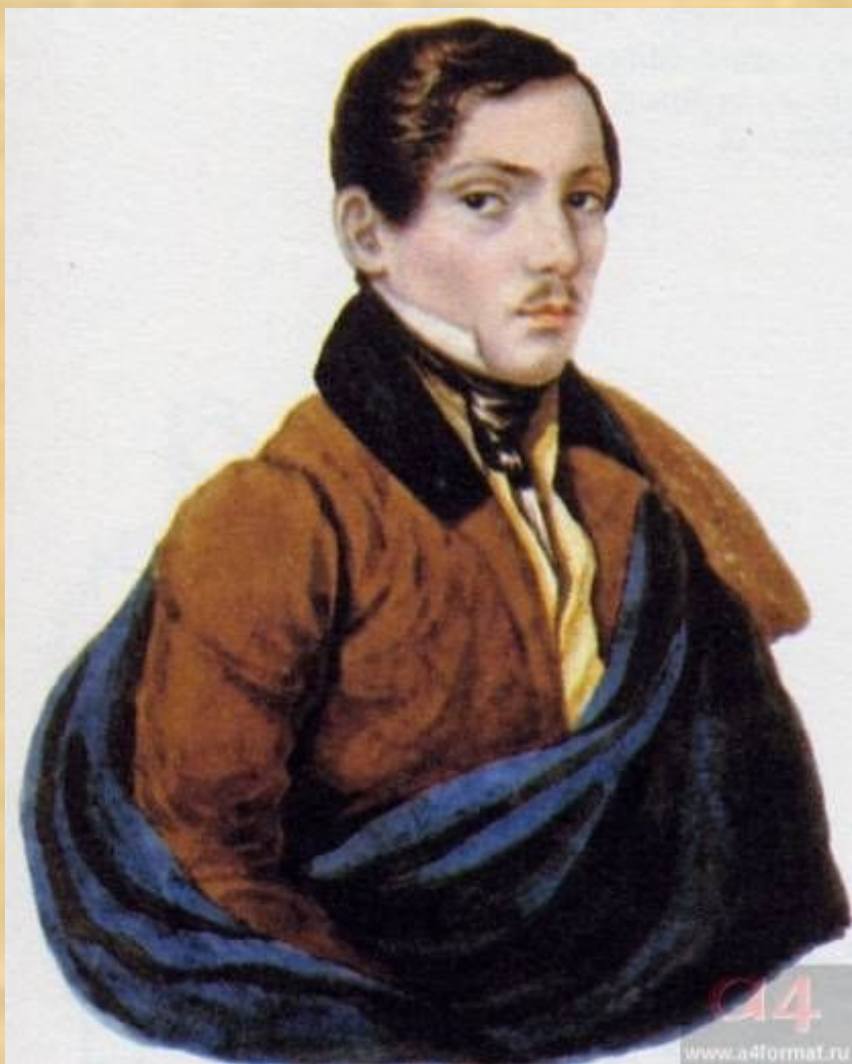
Неизвестный молодой человек в синем (С.А. Раевский?). Акварель