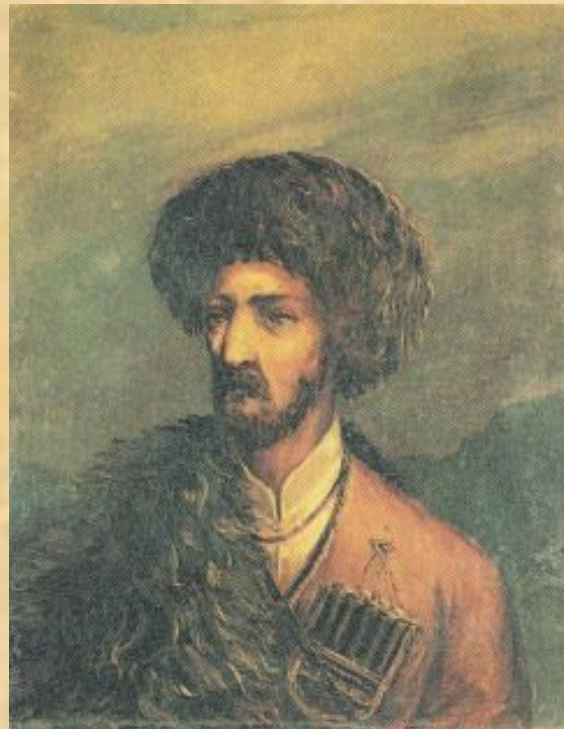
Черкес. Масло. 1838 г.