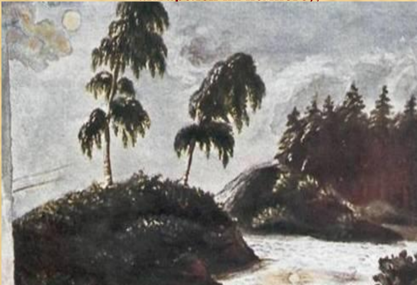
Пейзаж с двумя березами. Акварель. 1828—1832 г

Пейзажи (составляют большую часть картин Лермонтова и занимают значительное место среди его рисунков; среди акварелей их немного);