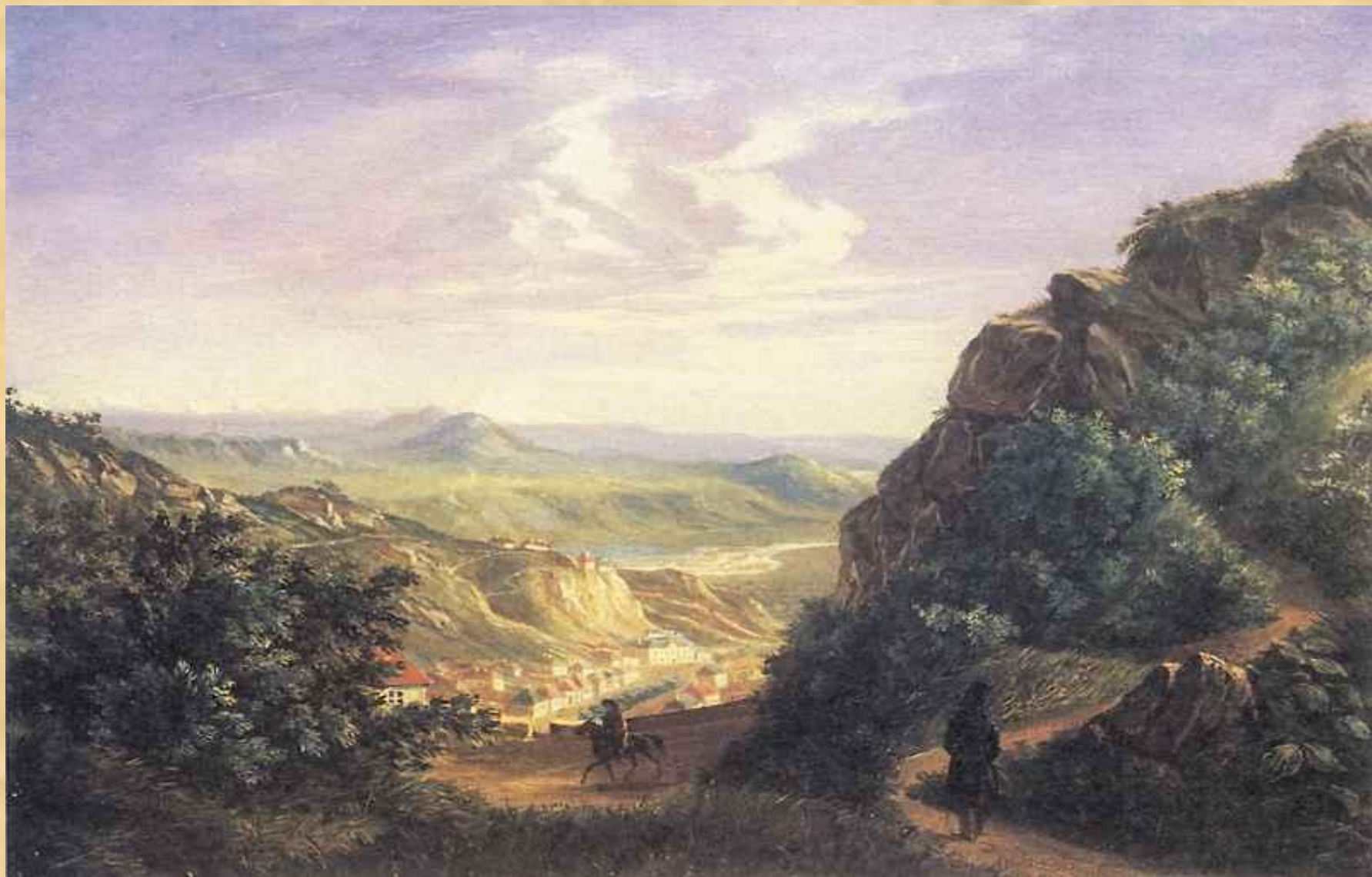
Вид Пятигорска. Акварель 1837 г.