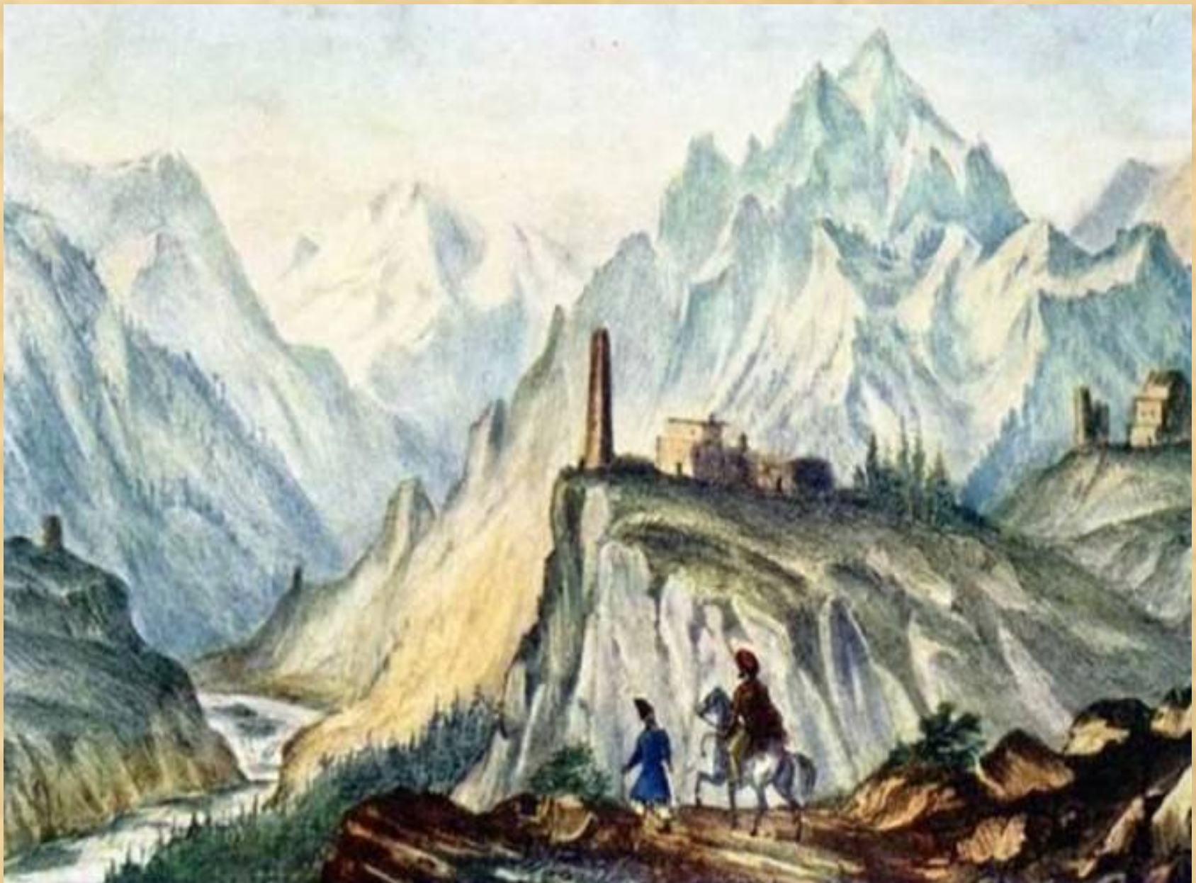
Вид Крестовой горы из ущелья близ Коби. Масло. 1837—38 г.