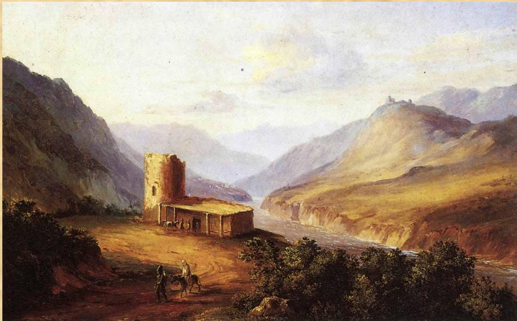
Кавказский вид сакли. Масло. Военно-Грузинская дорога близ Мцхета. 1837 г.