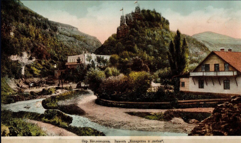
Окр. Кисловодск. Замок „Каваретва и любви“.

Летом 1825 бабушка повезла Лермонтова на воды на Кавказ; детские впечатления от кавказской природы и быта горских народов остались в его раннем творчестве ("Кавказ", 1830; "Синие горы Кавказа, приветствую вас!..", 1832). В 1827 семья переезжает в Москву, а в 1828 Лермонтов зачисляется полупансионером в 4-й класс Московского университетского благородного пансиона, где получает гуманитарное образование. Уже в Тарханах определился острый интерес Лермонтова к литературе и поэтическому творчеству. В 1828-1829 гг. он пишет поэмы "Корсар", "Преступник", "Олег", "Два брата" (опубликованы посмертно), "Последний сын вольности", "Измаил-Бей", "Демон".