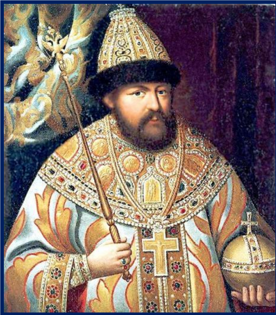
Алексей Михайлович Романов