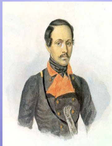
Лермонтов в сюртуке офицера Тенгинского пехотного полка