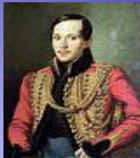
Лермонтов в расстёгнутом ментике с золотыми шнурами