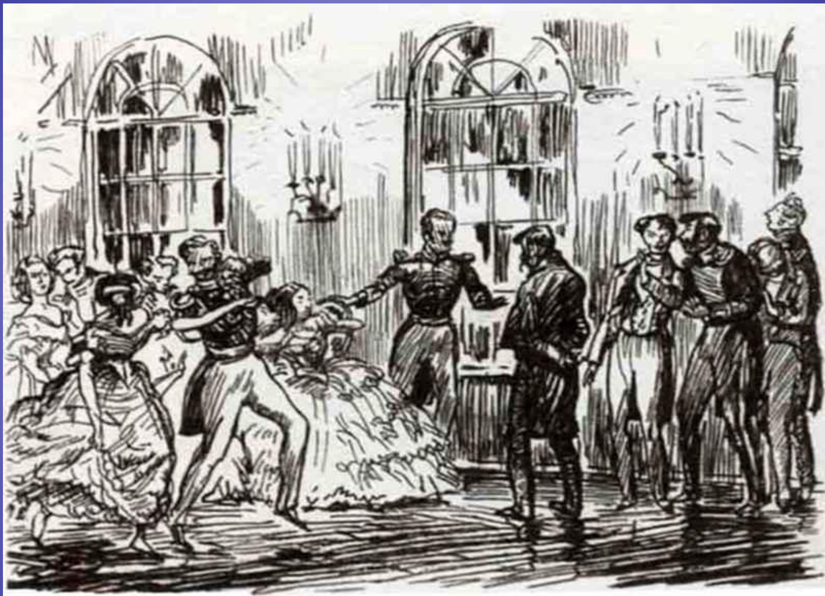
П.Я.Павлинов «Княжна Мэри»