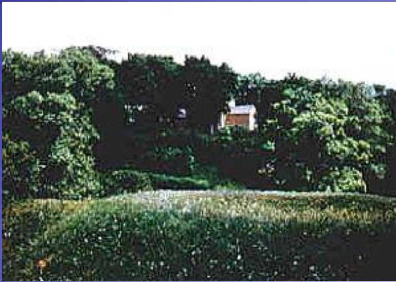
Траншеи - место военных игр М.Ю.Лермонтова