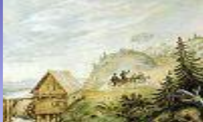
Пейзаж с мельницей и скачущей тройкой