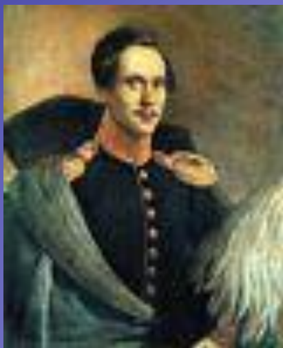
Лермонтов в вицмундире лейб-гвардии Гусарского полка