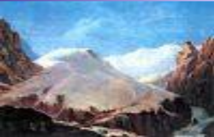
Одна из лучших живописных работ Лермонтова "Крестовая гора" написана под сильными впечатлениями от увиденного им на Кавказе.