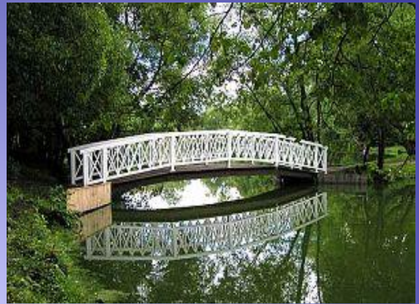
Мостик в парке