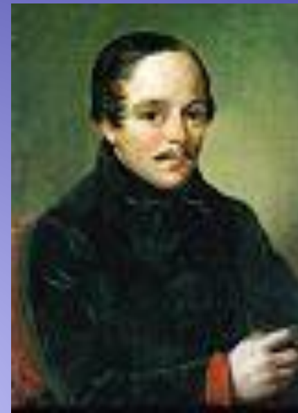
Лермонтов в штатском сюртуке