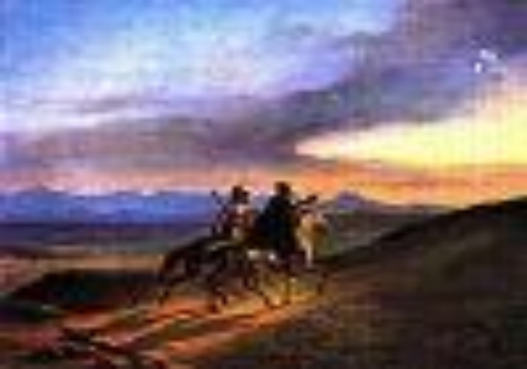
Воспоминание о Кавказе. Картина М.Ю. Лермонтова