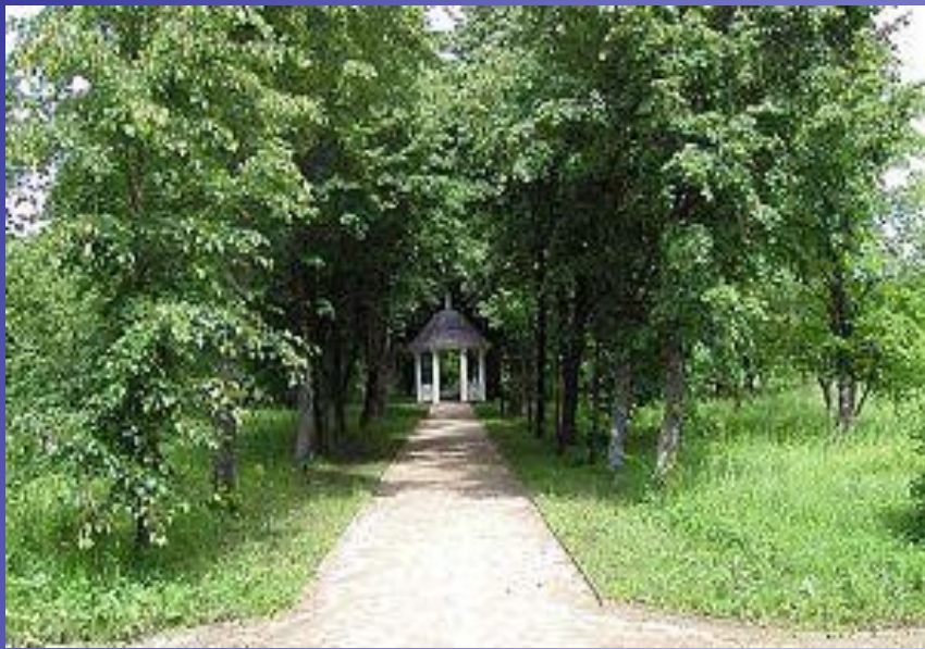
Беседка в Дальнем саду