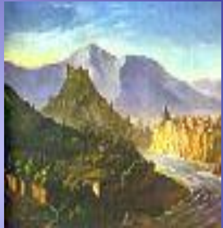
Полк, в котором служил Лермонтов, располагался недалеко от Тифлиса – всего в ста верстах. И поэт неоднократно бывал в этом замечательно древнем городе. Так появилась ещё одна замечательная картина Лермонтова "Вид Тифлиса".