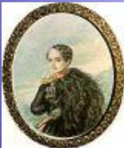
Лермонтов. Автопортрет. Акварель. 1837