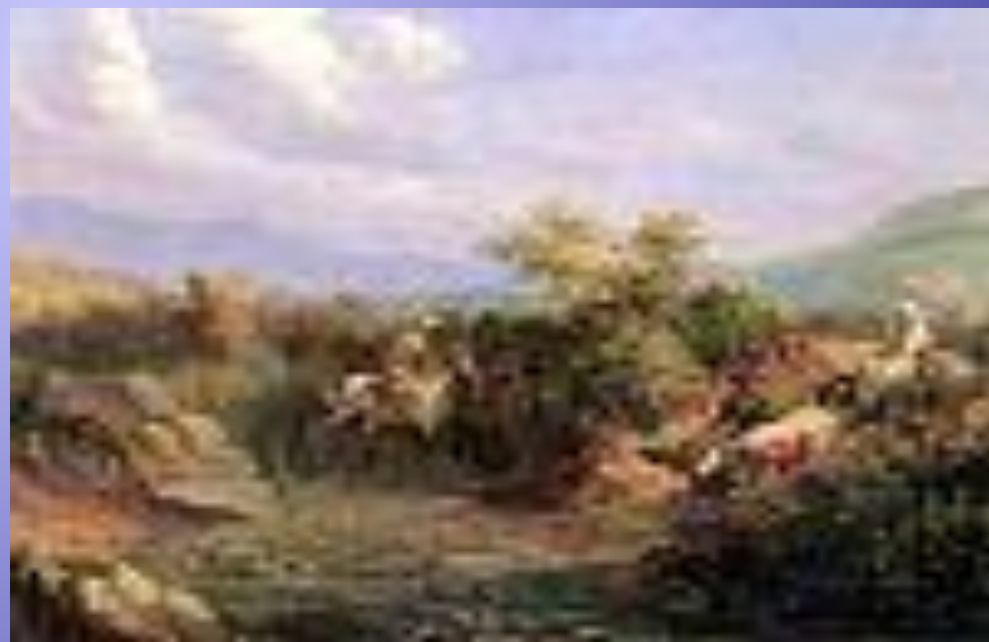
Нападение. Сцена из кавказской жизни