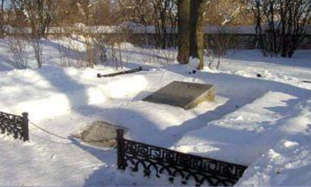
Могила Ю.П. Лермонтова

Между шестью и семью часами вечера у подножия Машука во время грозы и сильного дождя состоялась дуэль Лермонтова с Мартыновым. Лермонтов был убит.