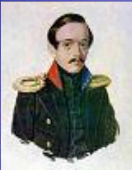
Лермонтов в сюртуке лейб-гвардии Гусарского полка