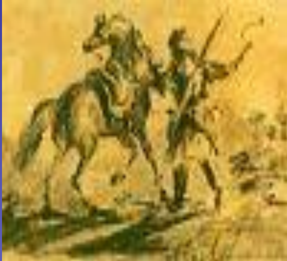
Черкес с лошадью