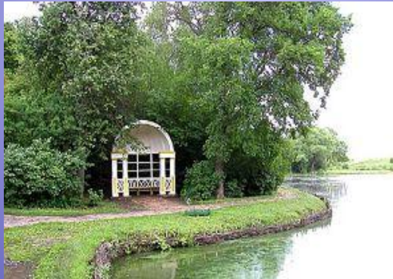
Беседка в парке