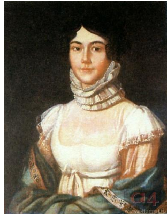
Мать Мария Михайловна Лермонтова, урожденная Арсеньева