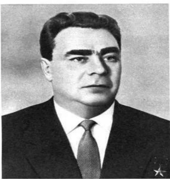
Л. И. БРЕЖНЕВ, Первый секретарь ЦК КПСС.