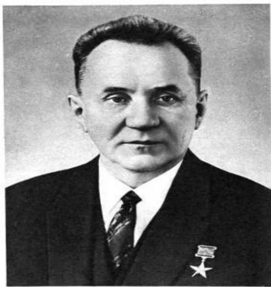
А. Н. КОСЫГИН, Председатель Совета Министров СССР.