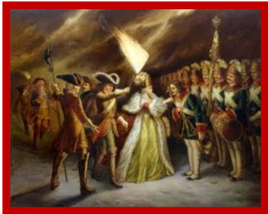
Филипп М.Р. Присяга преображенцев дочери Петра Великого.