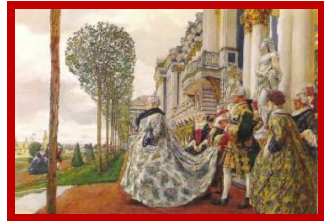
Императрица Елизавета Петровна в Царском Селе Е. Е. Лансере