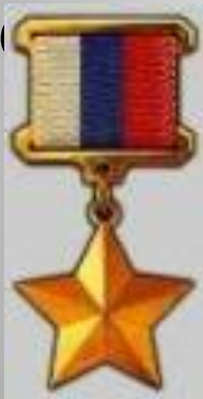
Золотая звезда Героя России