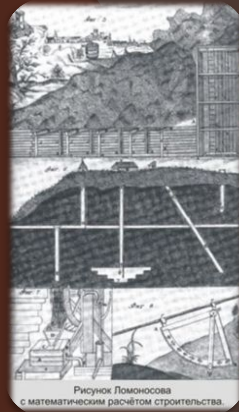
Рисунок Ломоносова с математическим расчётом строительства.

1741 - «Элементы математической химии» «Elementa Chimiae Mathematicae»