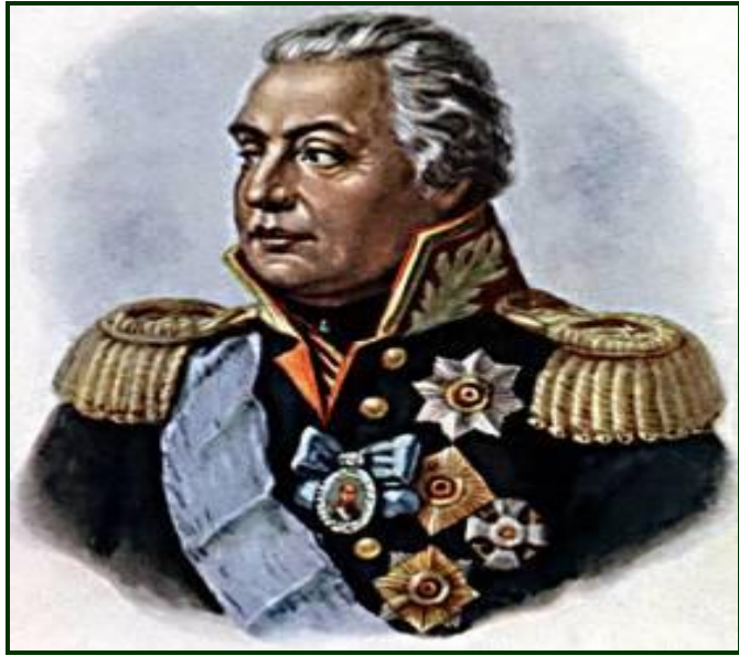
Михаил Илларионович Кутузов