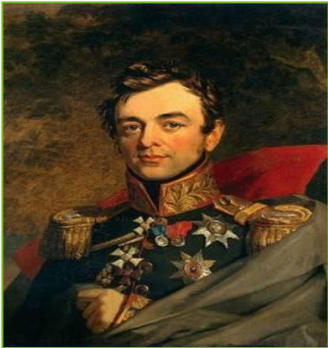
Иван Федорович Паскевич