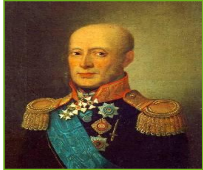
Михаил Богданович Барклай-де-Толли