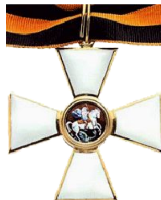
Орден Святого Георгия