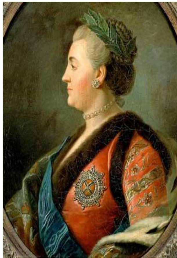
Екатерина II Великая

Замысел Петра I воплотила в жизнь царица Екатерина II. Отдавая должное воинской славе Русской армии и стремясь упрочить свое влияние на военных, она утвердила 26 ноября 1769 г. новый военный орден Святого Великомученика и Победоносца Георгия.