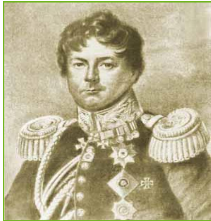
Иван Иванович Дибич-Забалканский