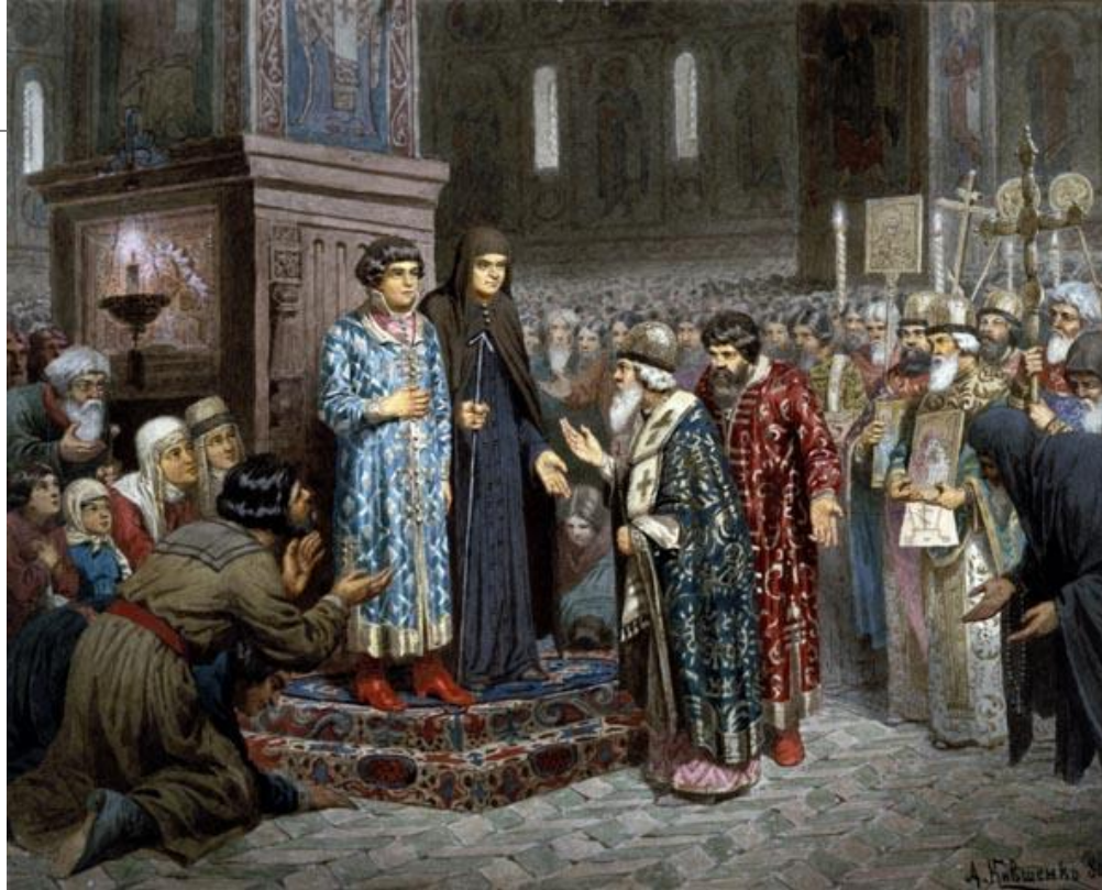
Призвание Романовых на царство. Худ. А. Кившенко

Февраль 1613 г. – Земский собор. Избрание царя.