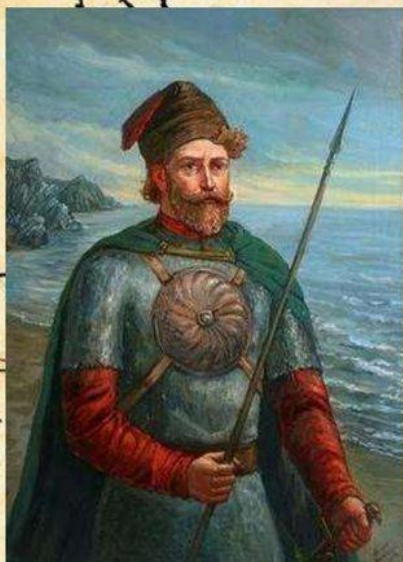
Иван Юрьевич и Константин Иванович МОСКВИТИНЫ

Казачий атаман Иван Москвитин - первооткрыватель Дальнего Востока, Охотского моря и острова Сахалин. В 1639 году отряд Ивана Москвитина вышел к берегам Тихого океана.