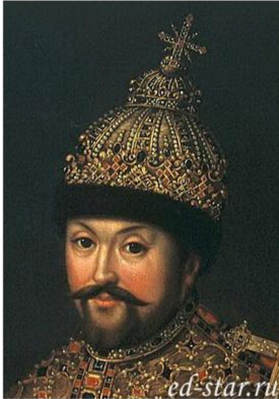
Прижизненный портрет Михаила Романова

Главная задача – окончательное изгнание с территории России шведов и поляков: 1617- Столбовский мир со Швецией (ПОТЕРЯ выхода к Балтийскому морю, в том числе многих городов: Ивангород, Ям, Копорье, Орешек) 1618- Деулинское перемирие с Польшей. (Россия потеряла Смоленские и Чернигово- Северские земли).