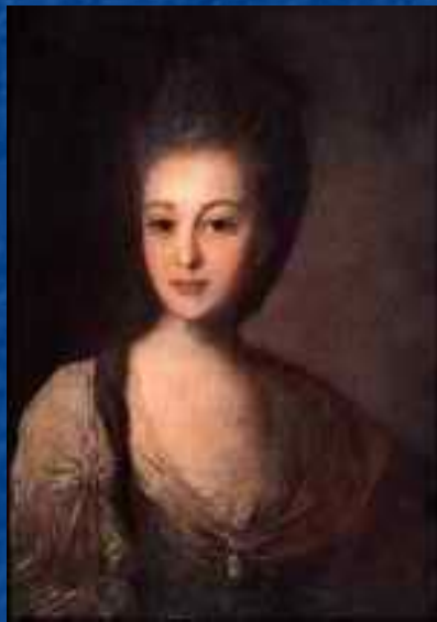
Портрет А.П. Струйской.