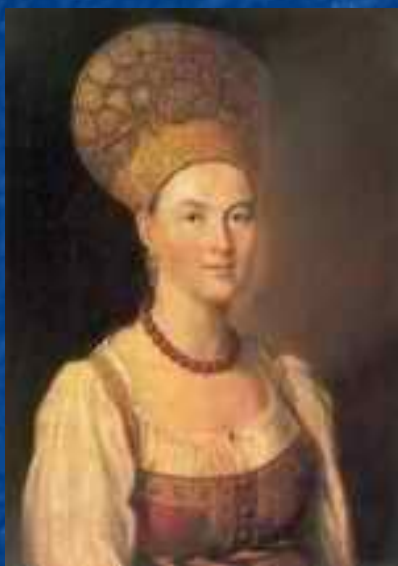
Портрет крестьянки в русском costume.