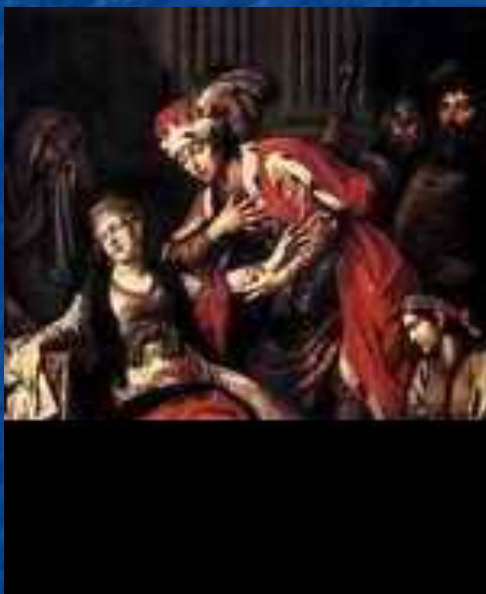
А.П. Лосенко «Владимир перед Рогнедой». Избрание Михаила Федоровича на царство.