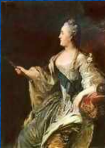
Портрет Екатерины II.