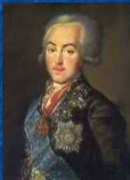
Портрет Н.П. Шереметьева.