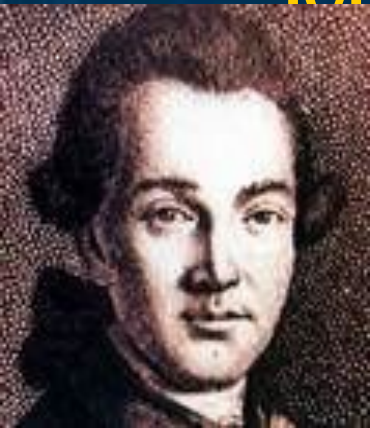
Сенат в Московском Кремле