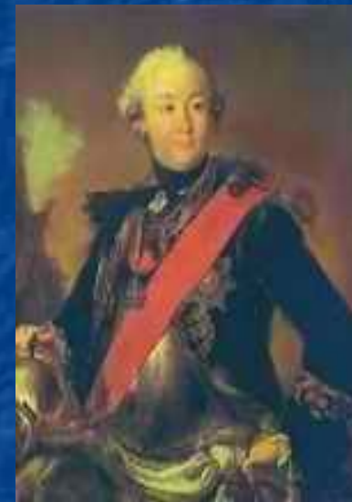
Портрет Г.Г. Орлова