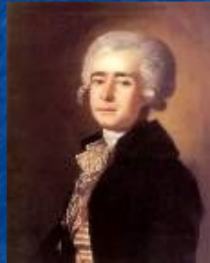
Е.И. Фомин (1761-1800) (1751-1825)