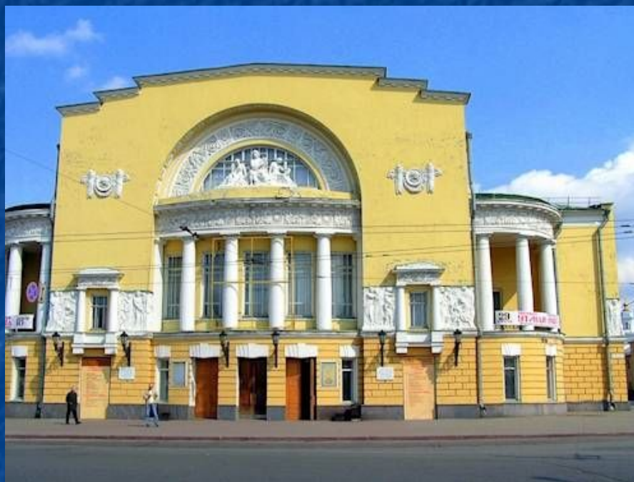
Российский государственный академический театр драмы имени Федора Волкова (Ярославль)