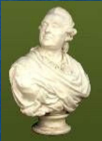
Портрет А.М. Голицина