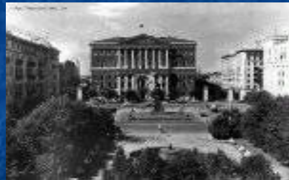
Дом Долгоруких в Москве