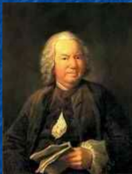
Портрет К.А. Хрипунова.