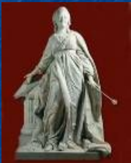
Екатерина – законодательница