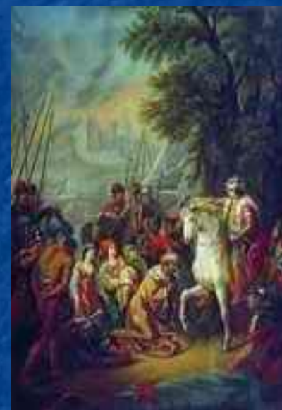
А.П.Лосенко «Взятие Казани»