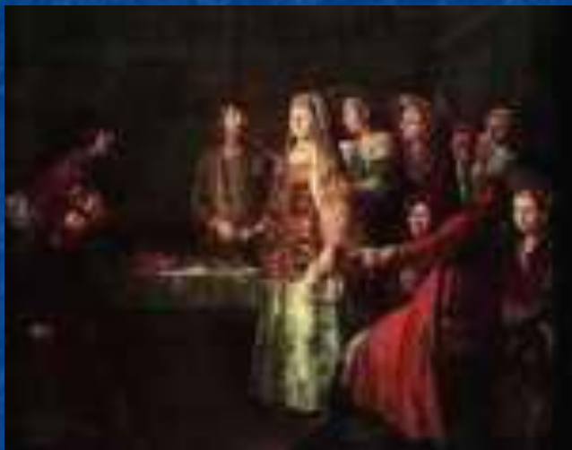
Празднество свадебного сговора