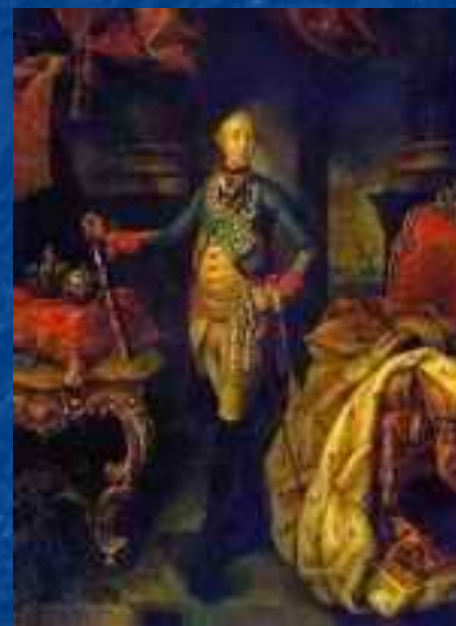
Парадный портрет Петра III.