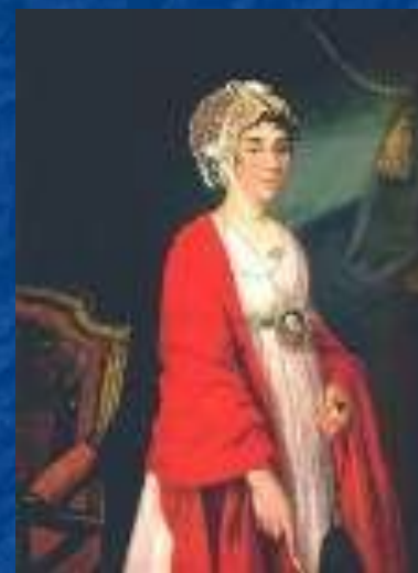
Портрет П.И. Ковалевой-Жемчуговой.