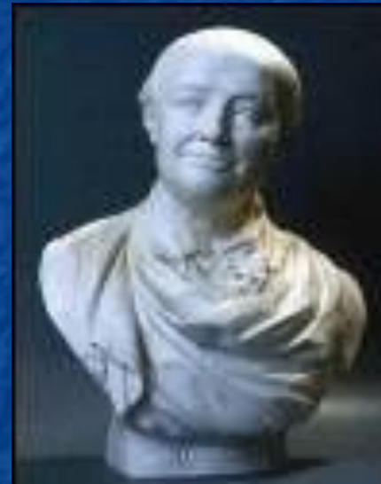
Портрет М. Ломоносова