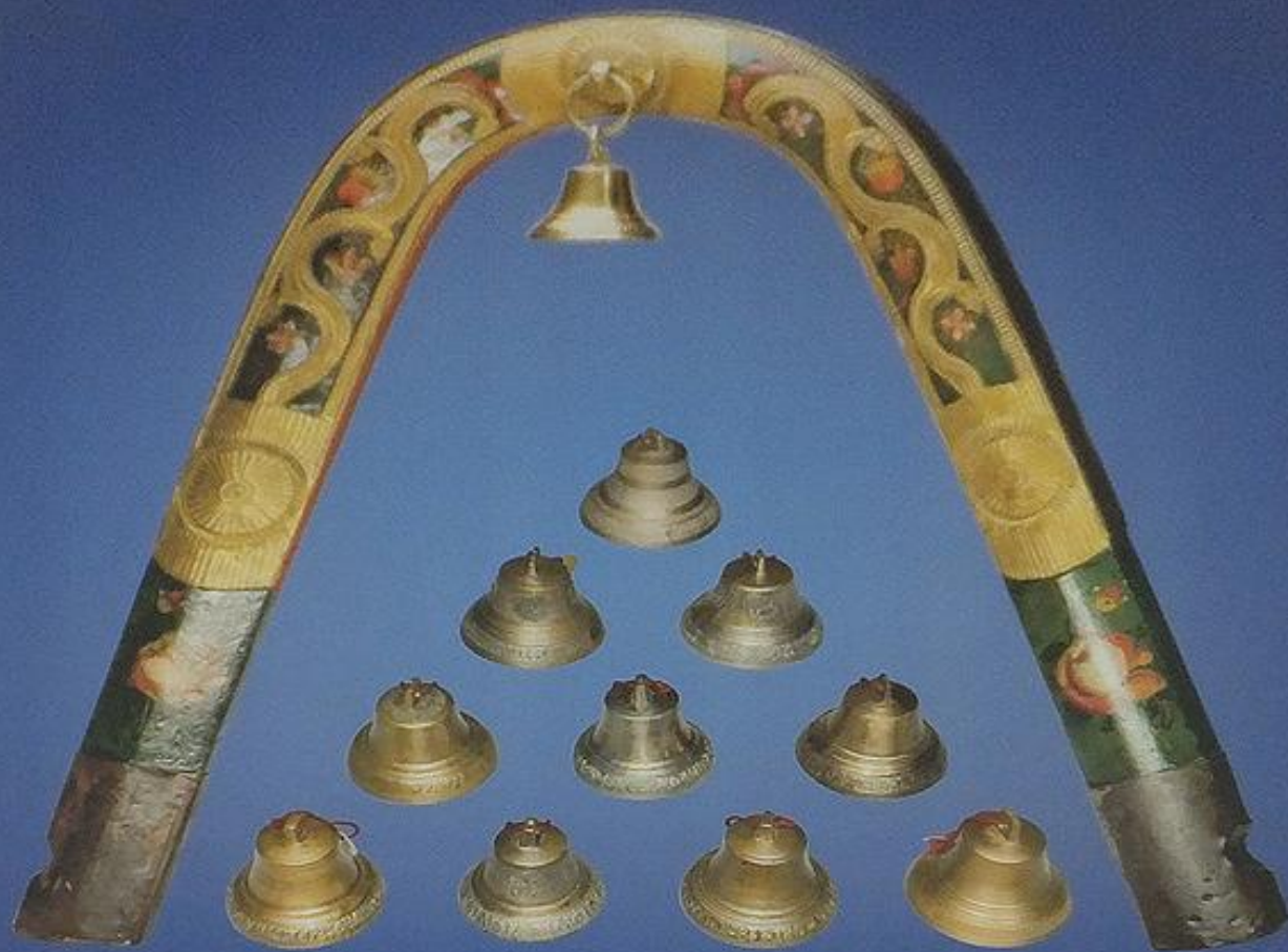
Дуга с колокольчиком к почтовой повозке

Российская империя. XIX в. Дерево, бронза Glockenpferdegeschirr für eine Postkutsche